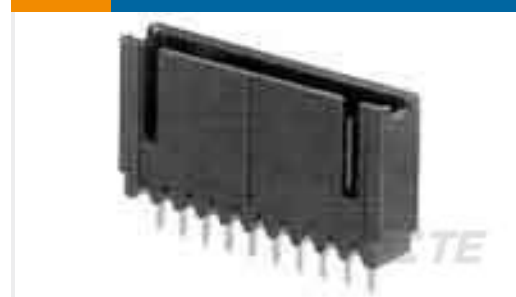
TE 产品编号5-102202-5 08 MODII HDR SRST SHRD LF