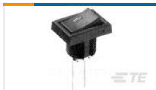
TE 产品编号1825420-2 TRD13F10WL04 rocker switch