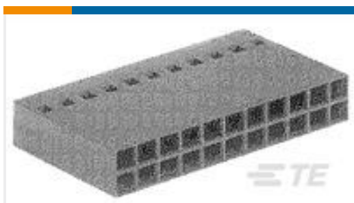
TE 产品编号1-104482-1 26 SHORT PT RCPT HSG DR .100CL