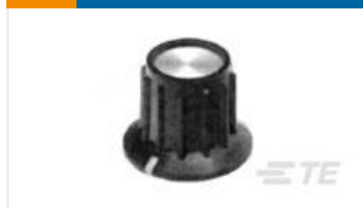
TE 产品编号1-1437624-1 PKA50B1/8=KNOB PLASTIC 1/8 SHA