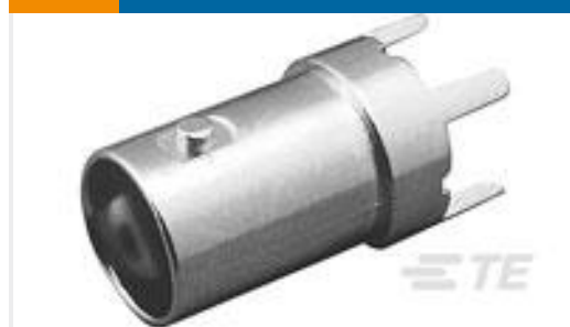
TE 产品编号5222420-1 JACK, VERT, PCB, COML BNC