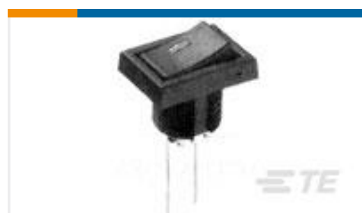
TE 产品编号1825420-2 TRD13F10WL04 rocker switch