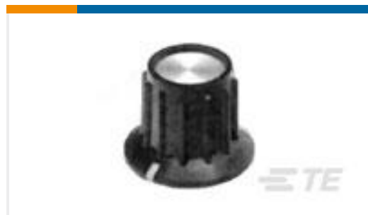
TE 产品编号1-1437624-1 PKA50B1/8=KNOB PLASTIC 1/8 SHA