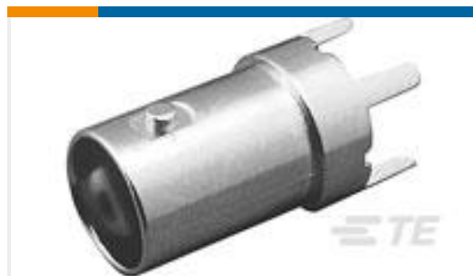
TE 产品编号5222420-1 JACK, VERT, PCB, COML BNC