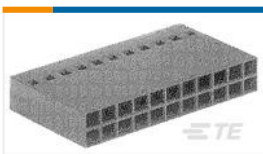
TE 产品编号1-104482-1 26 SHORT PT RCPT HSG DR .100CL