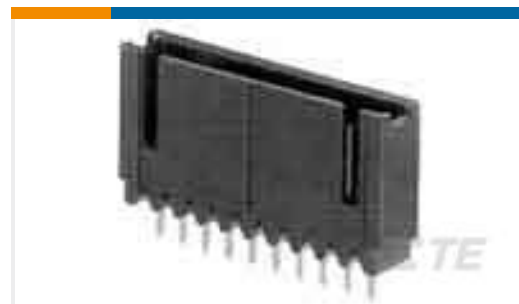
TE 产品编号5-102202-5 08 MODII HDR SRST SHRD LF