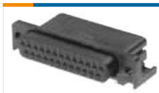
TE 产品编号 5747462-6 HD-20 RCPT 37P RA 590 FFSCRLK