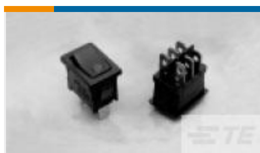
TE 产品编号 1571091-9 PRBSA1-16F-BB0HW=POWER ROCKER