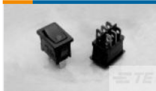
TE 产品编号 1571094-4 PRBSD3-16F-BB000,POWER ROCKER