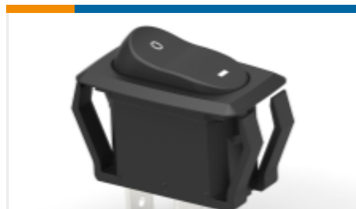
TE 产品编号 1571091-3 PRBSA1-16F-BB0CW=POWER ROCKER