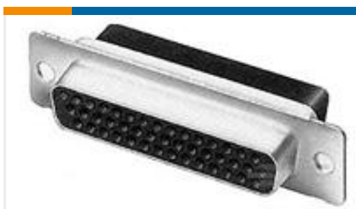
TE 产品编号 1658682-1 HDP-22,RCPT,SIZE 2,26 POSN