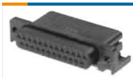
TE 产品编号 5747460-5 HD-20 RCPT 15P RA 590 FFSCRLK