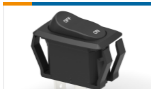
TE 产品编号 1571091-9 PRBSA1-16F-BB0HW=POWER ROCKER