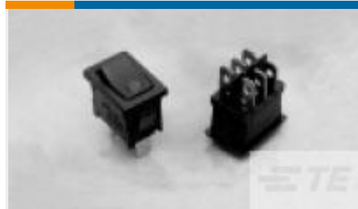
TE 产品编号 1571092-3 PRBSB1-16F-BA000=POWER ROCKER