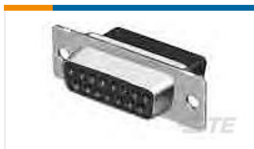
TE 产品编号 205203-8 CRIMP SNAP RCPT ASSY,SIZE 1