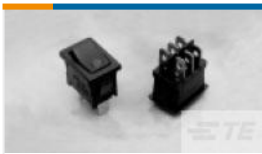
TE 产品编号 1571092-1 PRBSB1-16F-BR000=POWER ROCKER