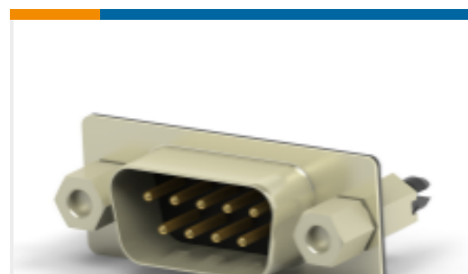
TE 产品编号 2301826-2 AMPL PLUG HD20, VERT, 9P, B/L,4-40 S/LOC