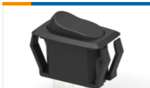
TE 产品编号 1571091-1 PRBSA1-16F-BB000=POWER ROCKER