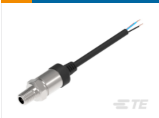
TE 产品编号20010080-00 PRESS XDCR M325M-000005-100PG