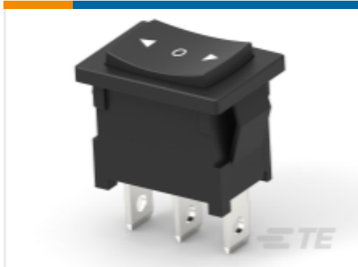
TE 产品编号 1-1571079-6 PRASD5-16F-BB0KW=POWER ROCKER