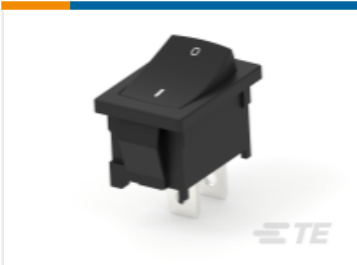
TE 产品编号 1-1571076-0 PRASA1-16F-BB0BW=POWER ROCKER