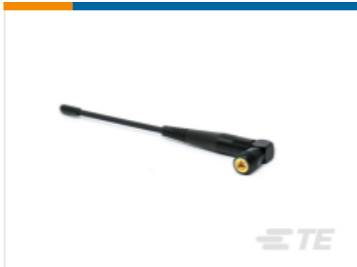
TE 产品编号0600-00028 ANT,900MHZ,2.5DBI