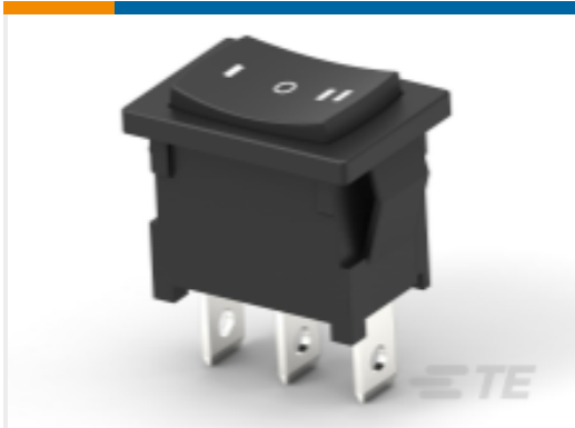
TE 产品编号 1571079-9 PRASD3-16F-BB0GW=POWER ROCKER