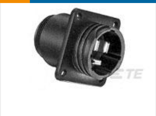
TE 产品编号213581-1 CPC STND SEX 17-3 THRD INSERTS