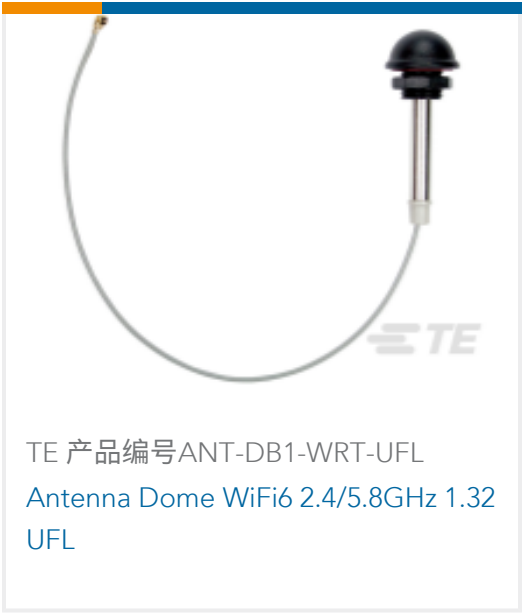
TE 产品编号ANT-DB1-WRT-UFL Antenna Dome WiFi6 2.4/5.8GHz 1.32 UFL