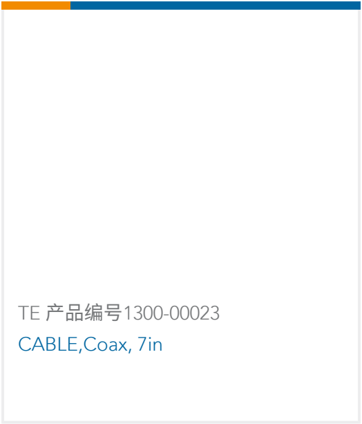
TE 产品编号1300-00023 CABLE,Coax, 7in