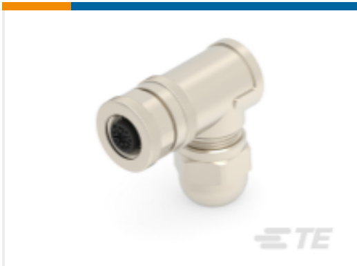
TE 产品编号T4112012081-000 M12 F, 8P GOLD A_CODE RA SHIELDED PG9