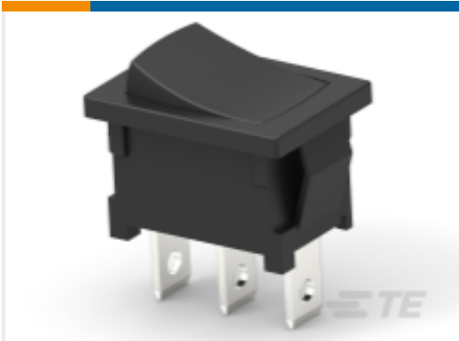
TE 产品编号 1571079-4 PRASD1-16F-BB000=POWER ROCKER