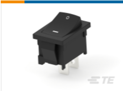
TE 产品编号 1-1571076-1 PRASA1-16F-BB0CW=POWER ROCKER