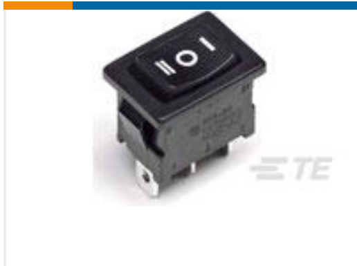
TE 产品编号 1571078-4 PRASB2-16F-BBR00=POWER ROCKER