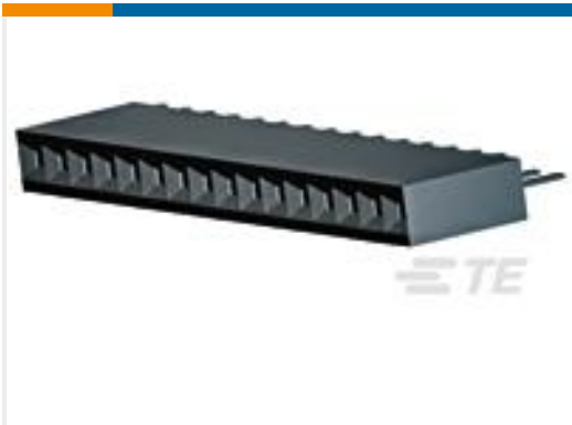
TE 产品编号6-535541-4 16 MODIV VRT SR CE 100/115