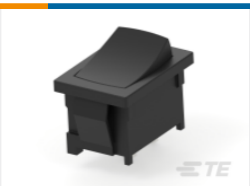
TE 产品编号 1-1571076-2 PRASA1-16L-BB000=POWER ROCKER