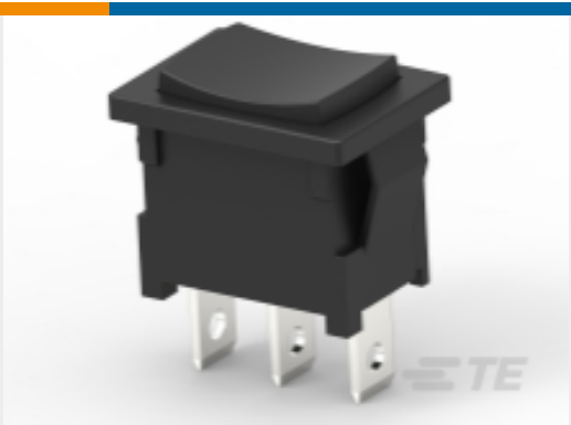
TE 产品编号 1571079-7 PRASD3-16F-BB000=POWER ROCKER