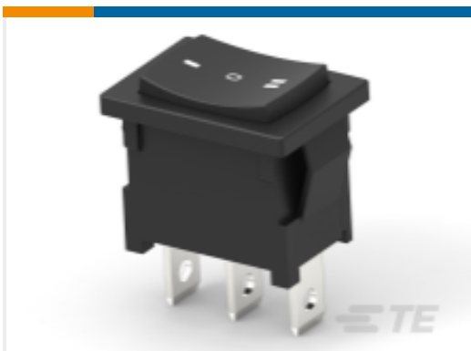
TE 产品编号 1-1571079-4 PRASD4-16F-BB0FW=POWER ROCKER