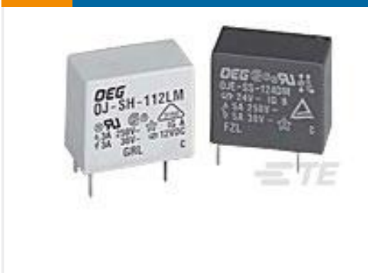
TE 产品编号1461400-1 OJE-SH-105DM,000