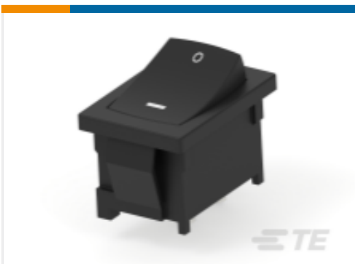
TE 产品编号 1-1571076-4 PRASA1-16L-BB0CW=POWER ROCKER