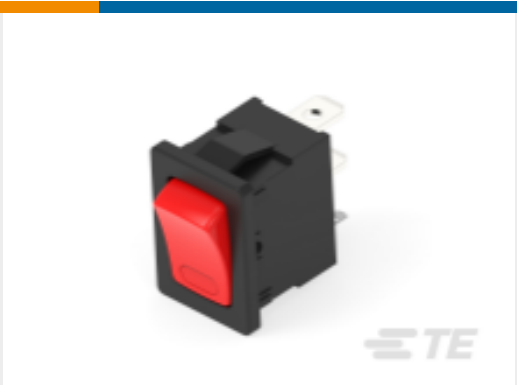
TE 产品编号 1571083-2 PRASC1-16F-BBR00=POWER ROCKER