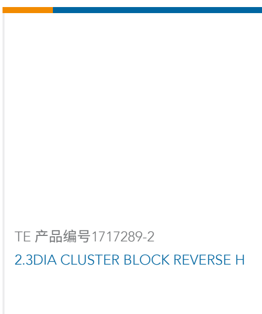
TE 产品编号1717289-2 2.3DIA CLUSTER BLOCK REVERSE H