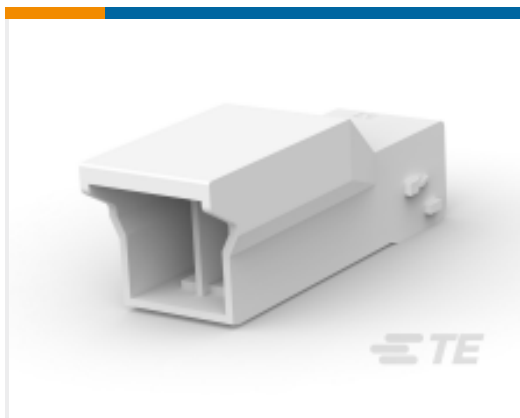
TE 产品编号3-1565086-4 STD 温度 GRACE INERTIA 盖帽