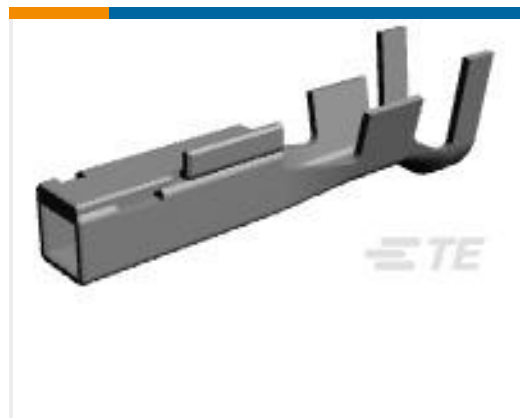
TE 产品编号1565079-1 GRACE INERTIA 3.5 REC CONTACT(L)