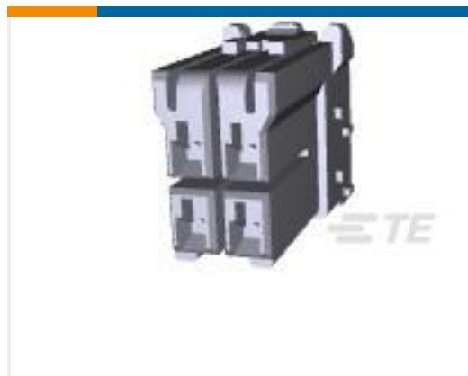
TE 产品编号1565083-1 GRACE INERTIA CONNECTOR 3.5 4P