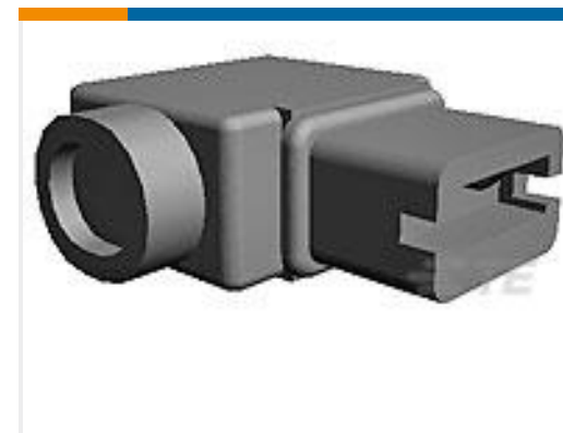
TE 产品编号1-178708-1 187 SLEEV PL EX FLAG NAT