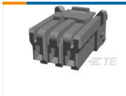
TE 产品编号1-1565082-2 GRACE INERTIA CONNECTOR 3.5 3P