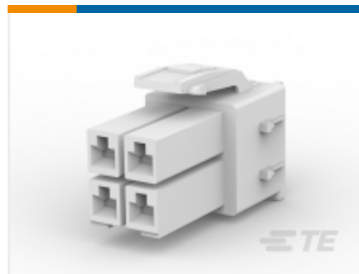
TE 产品编号179861-1 STD 温度电源双锁插头