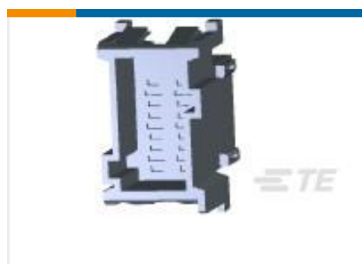
TE 产品编号4-965641-1 TAB HSG 2.8MM 6POS.