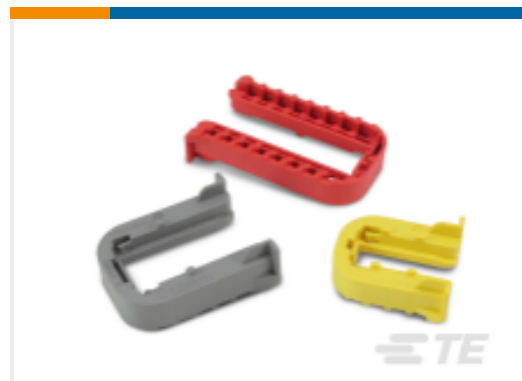
TE 产品编号1564562-5 重载密封系列连接器固定夹