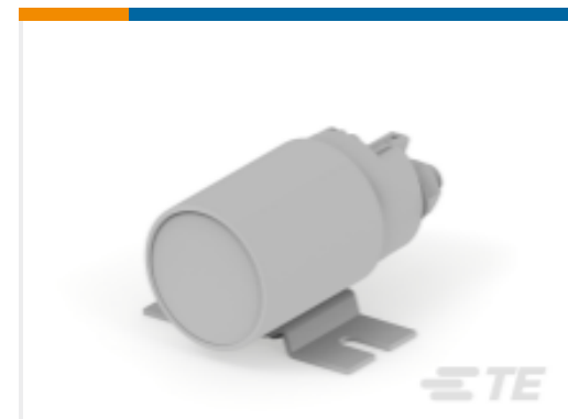
TE 产品编号K1020908 Relay 29-314-11