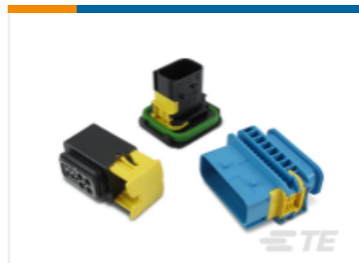
TE 产品编号1-1564518-1 重载密封系列连接器塑壳