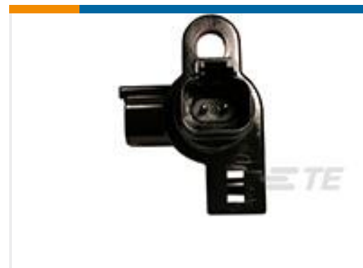
TE 产品编号DT04-2P-N006 REC, 2P, BLK, FEEDTHRU, NI