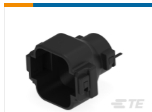
TE 产品编号1897076-2 MTII/SPT HYB SLD 12P CONN