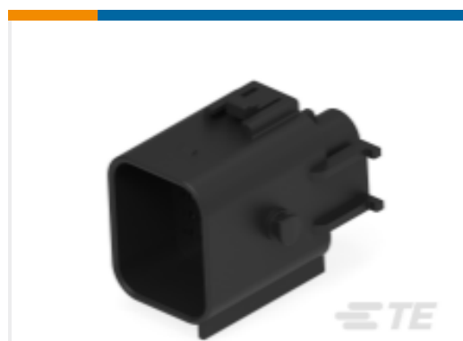
TE 产品编号1897075-2 MT-II/SPT HYB SLD 12P CAP HSG(BK)