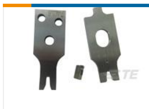
TE 产品编号7-2151981-7 OCEAN_2.0_SPARE_PART_KIT- 062F1250