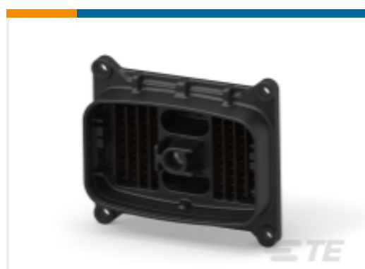
TE 产品编号DRCP25-86PBB-GC05 HDR, 86P, BLK, ST, 12/20, SN/NI/CU, BB