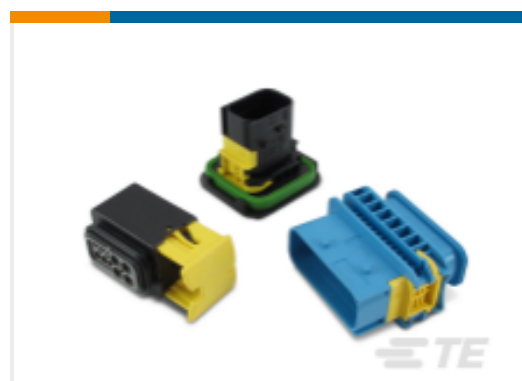
TE 产品编号1-1564414-1 重载密封系列连接器塑壳