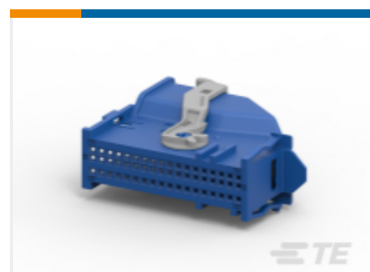
TE 产品编号1924337-3 SHIELD ASSEMBLY, 54 POSN, 0.64 MM KEY C-D