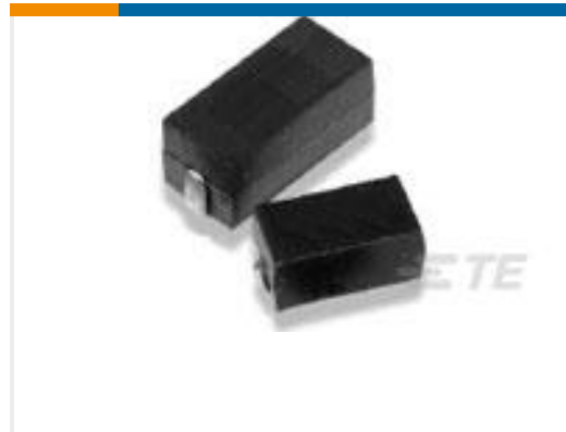
TE 产品编号5-1879233-2 SMW5 13R 5%