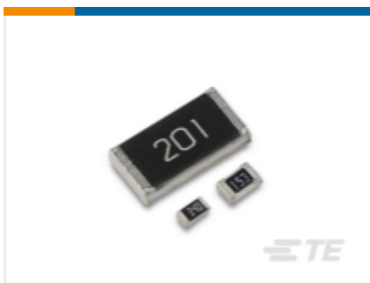
TE 产品编号5-2176326-0 CRGP 0603 120K 1%