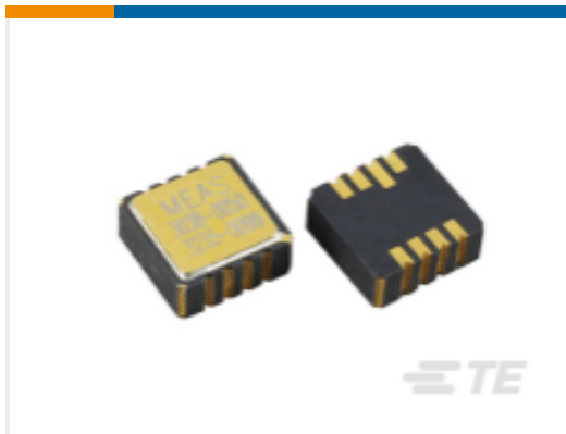
TE 产品编号3038-6000 3038-6000 SMT Accelerometer