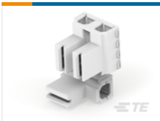
TE 产品编号 2238270-1 HSG, RECEP, 250 FASTON FLAG, 3P, T9G