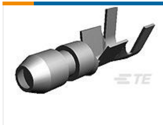
TE 产品编号170003-5 SHUR PLUG 156 REC 20-14 AWG TPBR