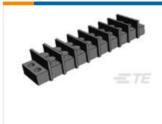
TE 产品编号1546306-8 8P .374" DR BARRIER STRIP