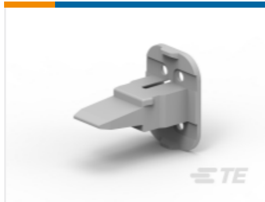
TE 产品编号W4SA-P012 WEDGE LOCK, 4P, PLG, GRY, SL RET, DT, A