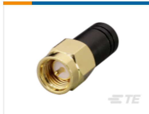
TE 产品编号ANT-868-NUB-SMA Antenna Compact Mini 868MHz SMA