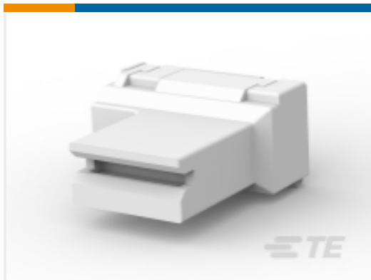
TE 产品编号 1969656-1 250 FASTON HSG.,FLAG,REC.,1 POS, NATRUAL