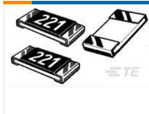
TE 产品编号2176070-7 3521 18R 1% 2W