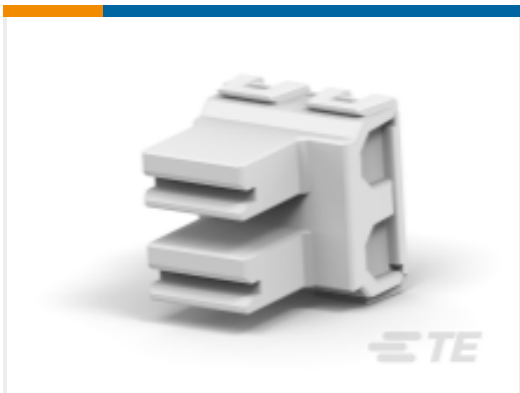
TE 产品编号 1969900-1 250 FASTON HSG.,FLAG,REC.,2 POS, NATRUAL