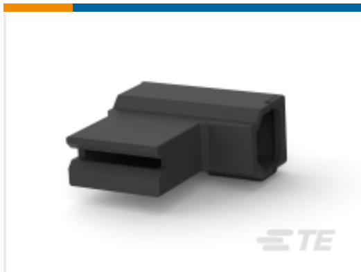
TE 产品编号 1969657-1 250 FASTON HSG.,FLAG,REC.,1 POS, BLACK