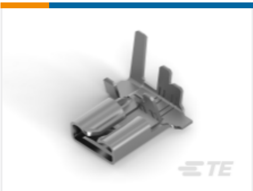
TE 产品编号 2238171-3 250 FASTON,FLAG,REC.,22-12 AWG, TPBR