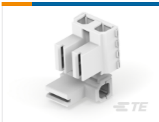
TE 产品编号 2238270-1 HSG, RECEP, 250 FASTON FLAG, 3P, T9G