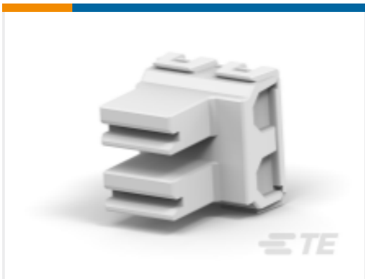
TE 产品编号 1969900-1 250 FASTON HSG.,FLAG,REC.,2 POS, NATRUAL