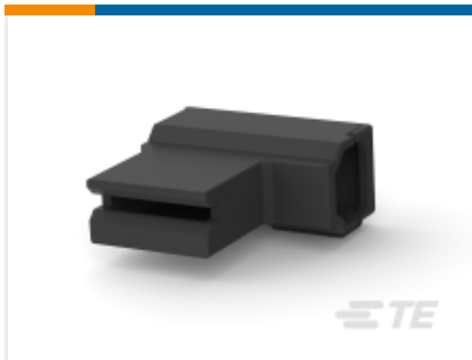
TE 产品编号 1969657-1 250 FASTON HSG.,FLAG,REC.,1 POS, BLACK