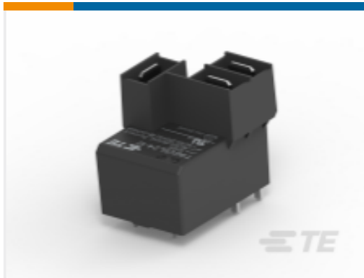
TE 产品编号1558672-2 T9GV2L24-9