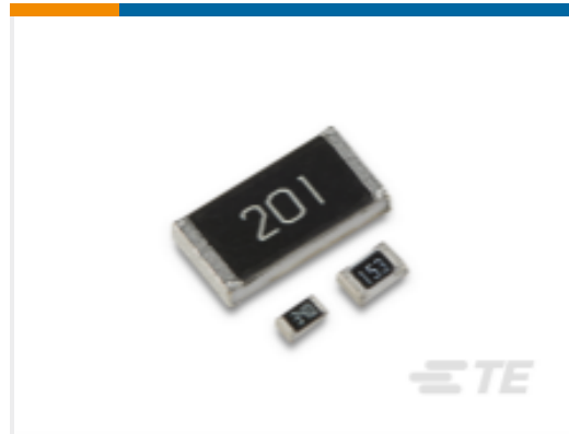
TE 产品编号2176326-6 CRGP 0603 27R 1%