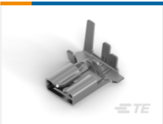
TE 产品编号 2238171-3 250 FASTON,FLAG,REC.,22-12 AWG, TPBR