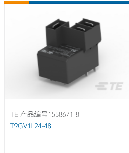
TE 产品编号1558671-8 T9GV1L24-48