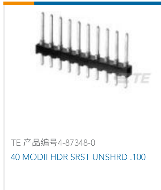
TE 产品编号4-87348-0 40 MODII HDR SRST UNSHRD .100