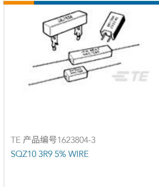
TE 产品编号1623804-3 SOZ10 3R9 5% WIRE