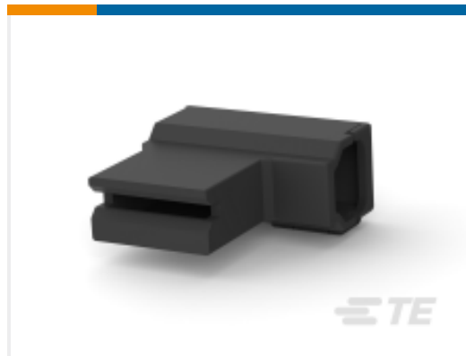
TE 产品编号 1969657-1 250 FASTON HSG.,FLAG,REC.,1 POS, BLACK