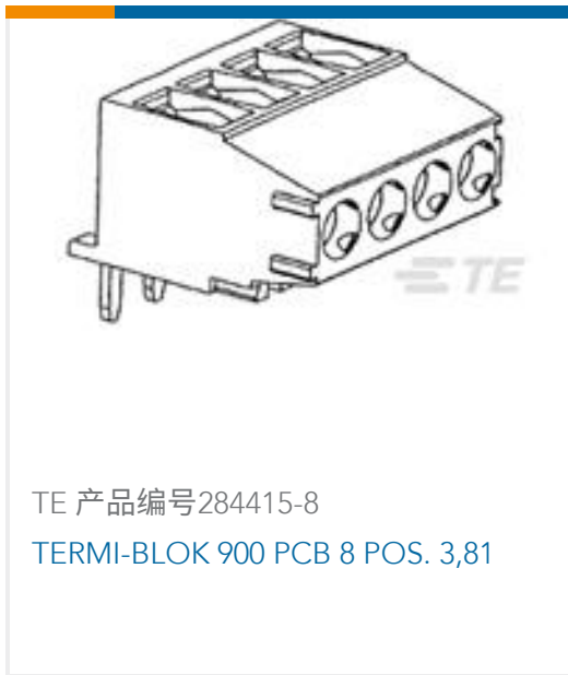
TE 产品编号284415-8 TERMI-BLOK 900 PCB 8 POS. 3,81