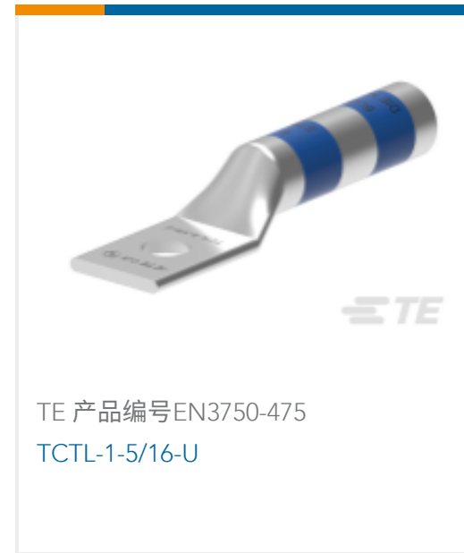
TE 产品编号EN3750-475 TCTL-1-5/16-U