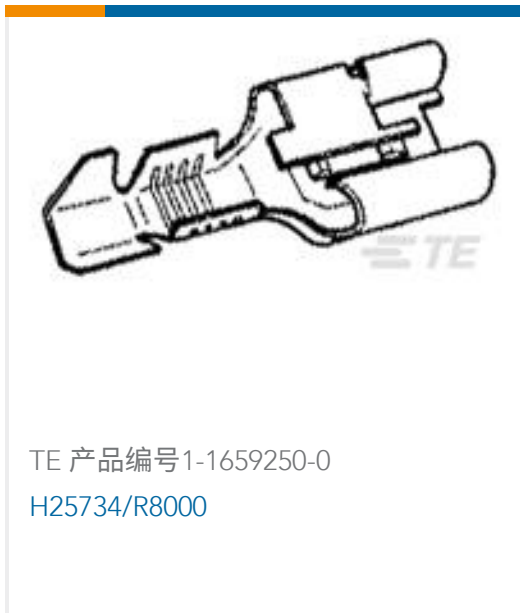
TE 产品编号1-1659250-0 H25734/R8000