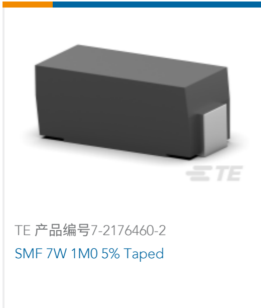
TE 产品编号7-2176460-2 SMF 7W 1M0 5% Taped