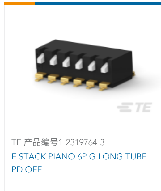
TE 产品编号1-2319764-3 E STACK PIANO 6P G LONG TUBE PD OFF