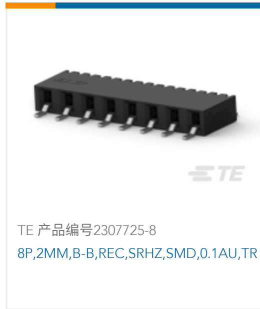
TE 产品编号2307725-8 8P,2MM,B-B,REC,SRHZ,SMD,0.1AU,TR