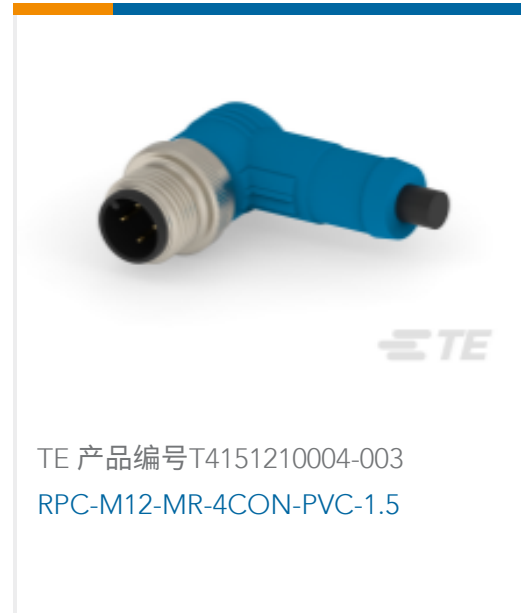
TE 产品编号T4151210004-003 RPC-M12-MR-4CON-PVC-1.5