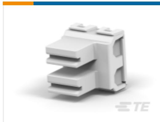
TE 产品编号 1969900-1 250 FASTON HSG.,FLAG,REC.,2 POS, NATRUAL