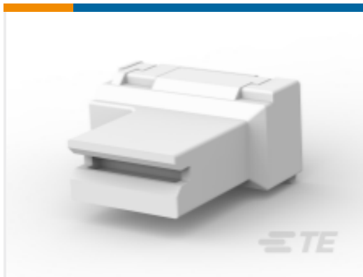
TE 产品编号 1969656-1 250 FASTON HSG.,FLAG,REC.,1 POS, NATRUAL