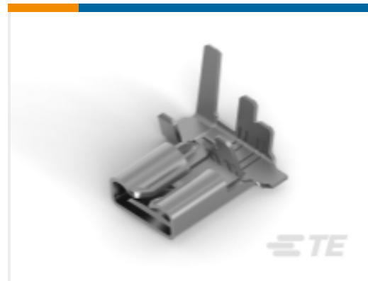
TE 产品编号 2238171-3 250 FASTON,FLAG,REC.,22-12 AWG, TPBR