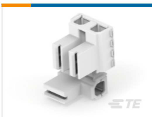
TE 产品编号 2238270-1 HSG, RECEP, 250 FASTON FLAG, 3P, T9G