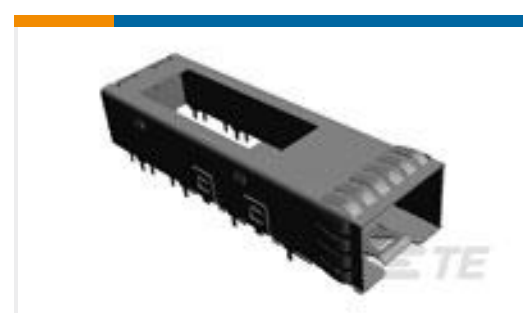
TE 产品编号2110304-1 SFP+ 1x1 Cage Assembly, Solder Tail