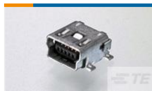
TE 产品编号1-1734035-2 MINI USB, TYPE B, R/A, SMT