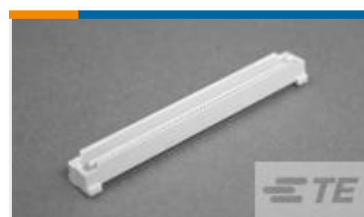
TE 产品编号5177984-6 0.8FH,P05H.5,140,08/Sn,TU