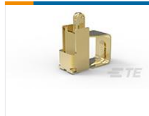
TE 产品编号 3-2199250-2 TYPE C 2.9H SPRING FINGER