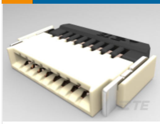
TE 产品编号 2328702-6 6PIN 0.5MMP FPC CONNECTOR, BACK FLIP LOCK