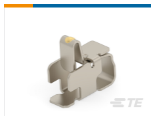
TE 产品编号 2306454-3 SPRING FINGER 2.3H