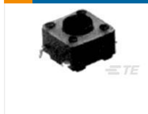
TE 产品编号 1977223-6 FSM2JSMASTR=6MM TACT SWITCH,