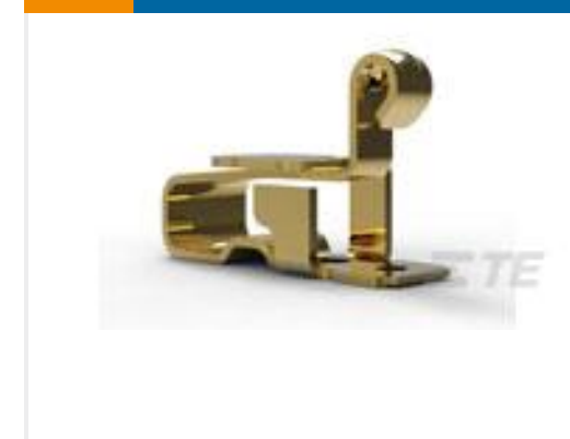
TE 产品编号 1551573-5 Shield Finger, Loose Piece