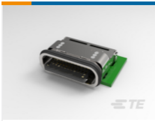
TE 产品编号 2305018-2 USB TYPE C, REC IPX8 ON BOARD DUAL SMT