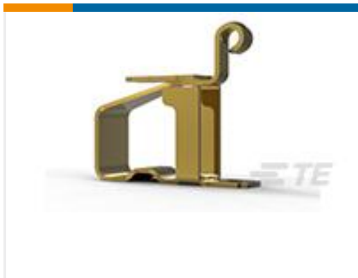
TE 产品编号 1551576-5 Shield Finger, 3.4mm