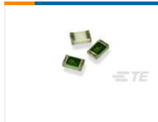
TE 产品编号 1879215-2 CPF 0402 4K12 0.1% 25PPM 1K RL