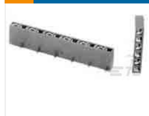
TE 产品编号 1241152-5 5P HV100 REC. CON, SMD, GOLD, BLISTER