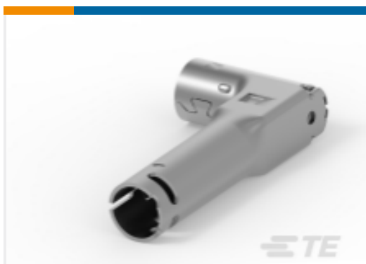
TE 产品编号2327551-1 MATE-AX,SOC OTR TRMNL ASSY, 90DEG