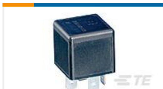
TE 产品编号7-1393304-4 V23134M1053C642-EV-CBOX