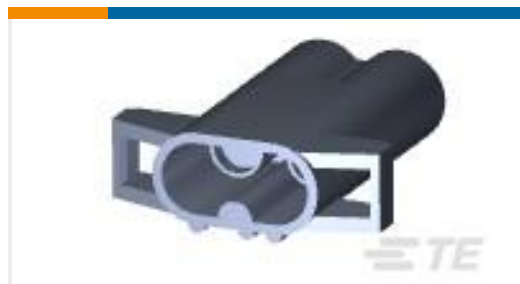
TE 产品编号151679 2 WAY M-N-L PIN HSG.NAT.