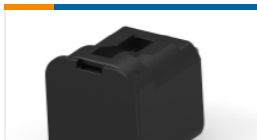
TE 产品编号1-2378550-1 4P MATE-AX,HDR ASSY,180DEG,COD A,CAP