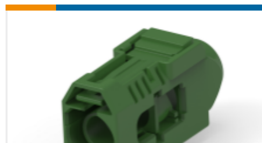
TE 产品编号2326911-5 FAKRA AUT,SOC HSG,UNSLD, 180DEG,COD E