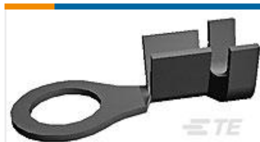
TE 产品编号160101-9 RING TONGUE 20-16 AWG 0.0253 NPBR