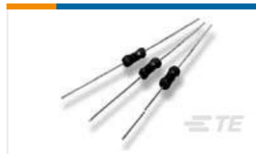
TE 产品编号9-1879352-1 RR02 5% 1K8 AMMO