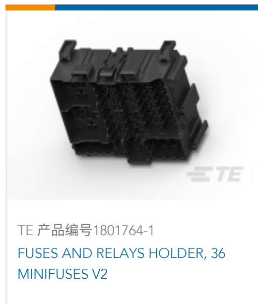
TE 产品编号1801764-1 FUSES AND RELAYS HOLDER, 36 MINIFUSES V2