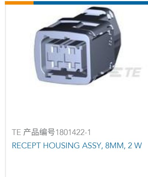
TE 产品编号1801422-1 RECEPT HOUSING ASSY, 8MM, 2 W