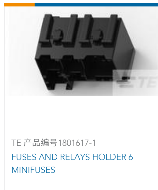
TE 产品编号1801617-1 FUSES AND RELAYS HOLDER 6 MINIFUSES