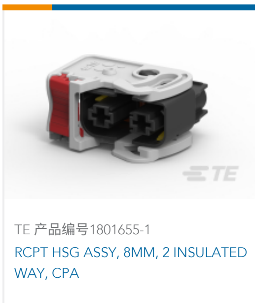
TE 产品编号1801655-1 RCPT HSG ASSY, 8MM, 2 INSULATED WAY, CPA