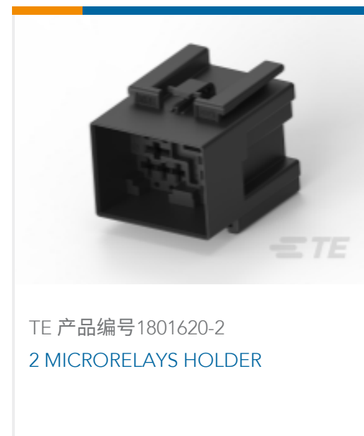
TE 产品编号1801620-2 2 MICRORELAYS HOLDER