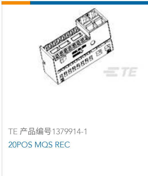
TE 产品编号1379914-1 20POS MQS REC