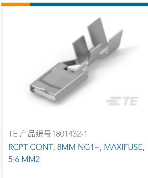
TE 产品编号1801432-1 RCPT CONT, 8MM NG1+, MAXIFUSE, 5-6 MM2