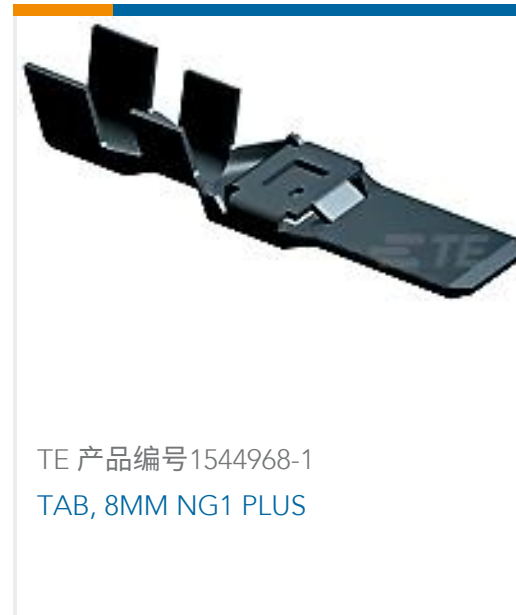
TE 产品编号1544968-1 TAB, 8MM NG1 PLUS