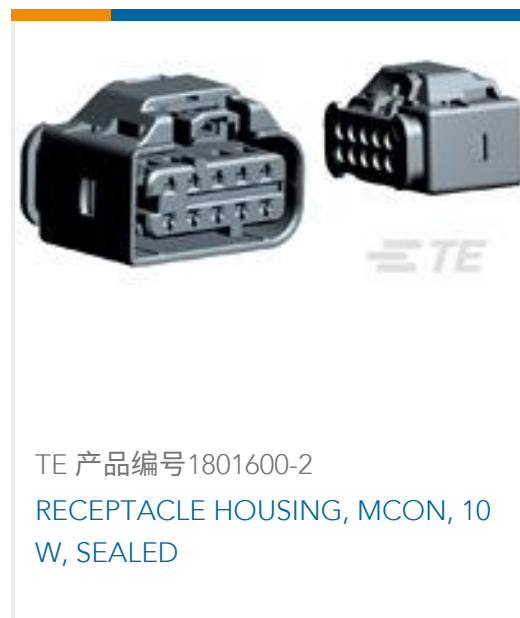
TE 产品编号1801600-2 RECEPTACLE HOUSING, MCON, 10 W, SEALED