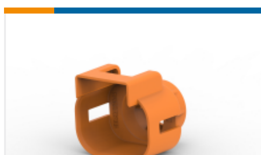
TE 产品编号2103013-3 CABLE SEAL RETAINER, SIZE 2, OR, HVA280