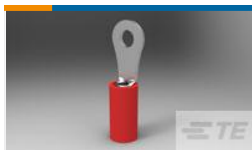
TE 产品编号2-330648-1 PIDG 22-16 22-18 MIL R 4; TAPE