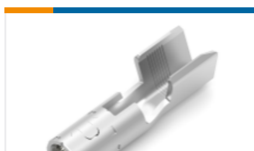
TE 产品编号2208669-3 8MM HV, CONTACT,ASSY