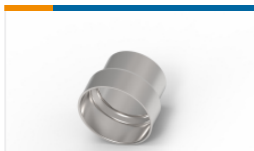
TE 产品编号2177090-3 STEEL,OUTER FERRULE,8MM HV, 25SQMM