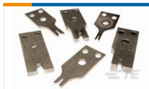
TE 产品编号1-1633961-2 CRIMPER, INSULATION F PREMIUM