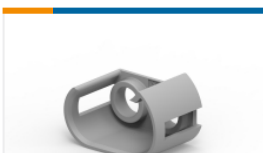
TE 产品编号1587940-3 CABLE SEAL RETAINER, SIZE C