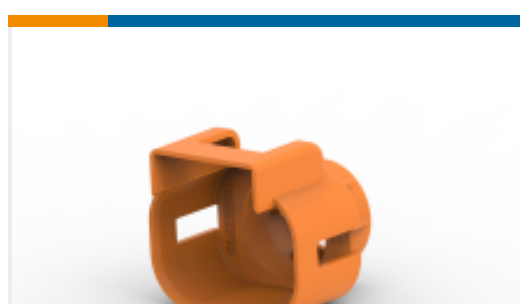
TE 产品编号2103013-3 CABLE SEAL RETAINER, SIZE 2, OR, HVA280