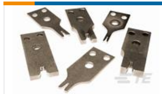
TE 产品编号1-1633961-2 CRIMPER, INSULATION F PREMIUM