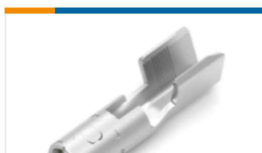
TE 产品编号2208669-3 8MM HV, CONTACT,ASSY