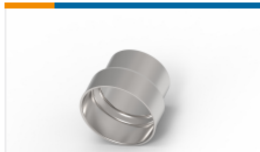
TE 产品编号2177090-3 STEEL,OUTER FERRULE,8MM HV, 25SQMM