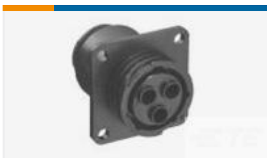
TE 产品编号788189-2 CPC 17-3 RCPT ASY,REV SEX