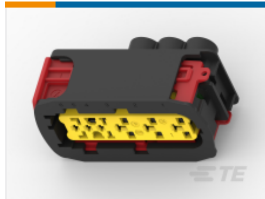
TE 产品编号 1544938-1 6 W HYBRID SEALED HSG