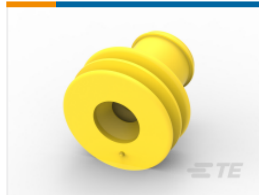
TE 产品编号 1544941-1 SINGLE WIRE SEAL 2,5 TO 4 MM2