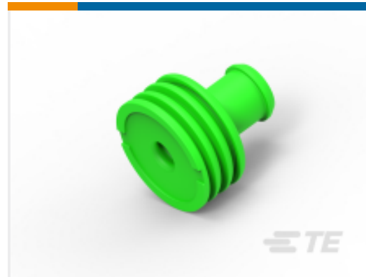
TE 产品编号 967608-1 PQ EINZELLEITDICHTG