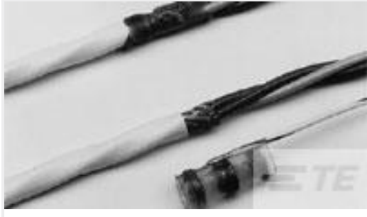
TE 产品编号625250-000 D-128-0008