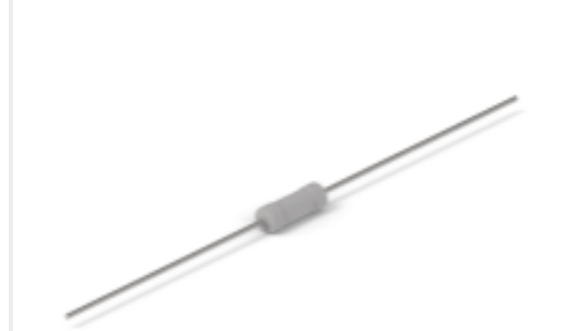
TE 产品编号6-1676123-0 1/2W SM M/OX 5% 240R