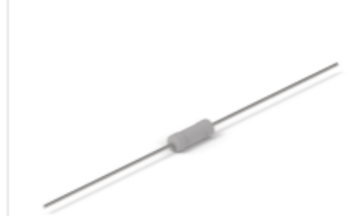
TE 产品编号7-1676123-7 1/2W SM M/OX 5% 1K2