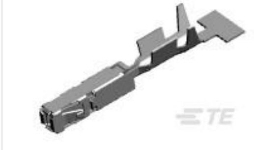
TE 产品编号1418410-1 AMP MCP 1.5K, CONTACT