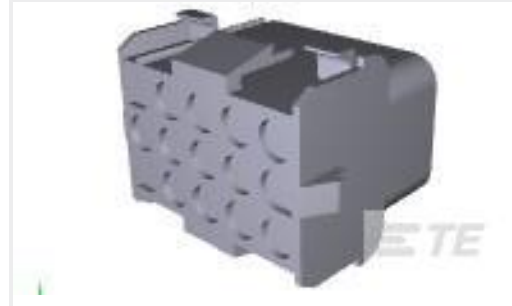
TE 产品编号926647-2 15P UN-MNL AUFN-GEH