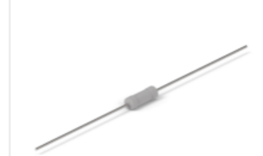
TE 产品编号7-1676123-9 1/2W SM M/OX 5% 1K5