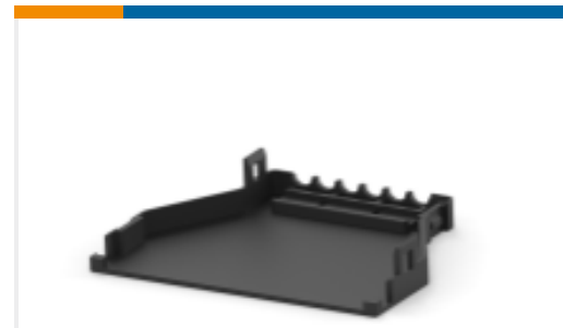
TE 产品编号1776695-1 Strain Relief, D5200, Dynamic