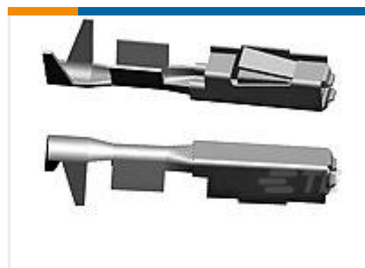
TE 产品编号2141824-1 MQS0,63 Sn rec LL unseal. 0,13-0,17