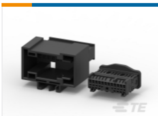
TE 产品编号1534579-1 MQS 连接器外壳