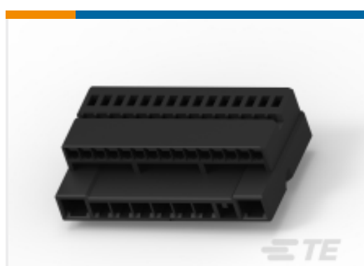
TE 产品编号2112669-1 23POS MIXED MQS REC