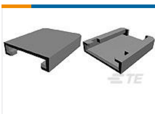
TE 产品编号144936-1 LOCKING DEVICE MQS