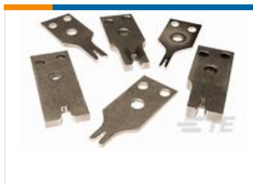
TE 产品编号7-568176-0 CRIMPER, WIRE (.050" 'F')