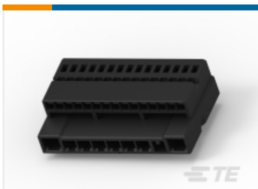
TE 产品编号2112669-1 23POS MIXED MQS REC