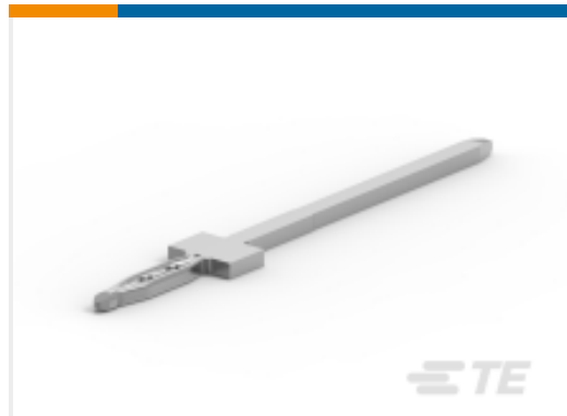
TE 产品编号2-963964-8 免焊接插针端子