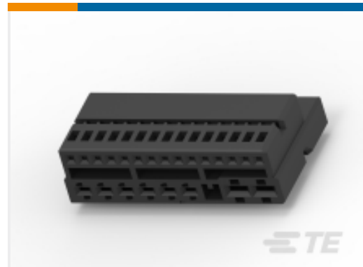
TE 产品编号2112668-1 23POS MIXED MQS REC