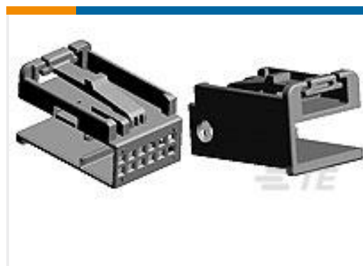
TE 产品编号1-1355524-3 MQS ABDECKKAPPE 12P