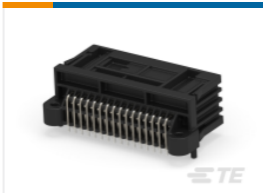
TE 产品编号969599-1 32pos MQS .63 header 90deg