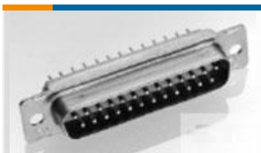
TE 产品编号1757819-6 AMPLIMITE,ASY,PLUG,STD,109,ZN,1,CT