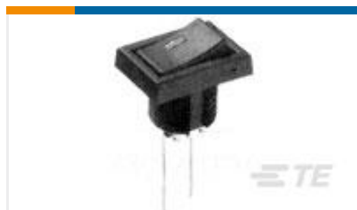
TE 产品编号1825420-2 TRD13F10WL04 rocker switch