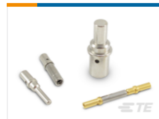
TE 产品编号0460-202-16141 DEUTSCH Solid Contacts