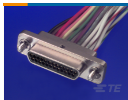
TE 产品编号 1532173-5 M83513/04-C09N, MCKS-N1-B-21S6Q1-18.0