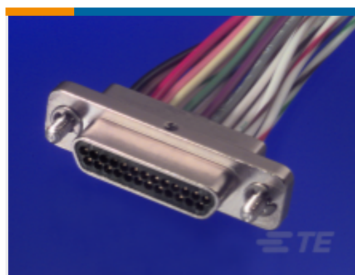
TE 产品编号 1-1532173-1 M83513/04-C15N, MCKS-N1-B-21S6Q1-72.0