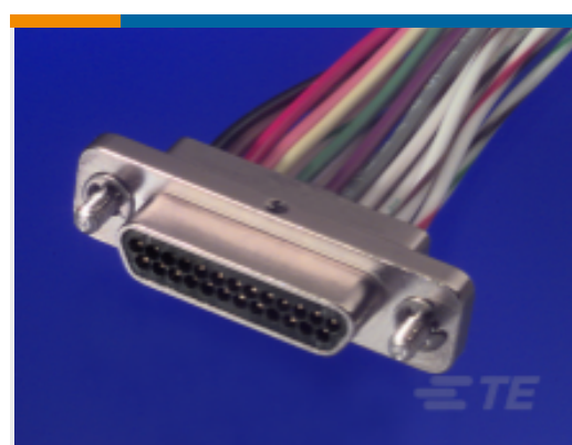
TE 产品编号 1532173-4 M83513/04-C04N, MCKS-N1-B-21S6G9-36.0