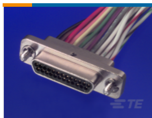
TE 产品编号 1-1532173-2 M83513/04-C16N, MCKS-N1-B-21S6Q9-72.0