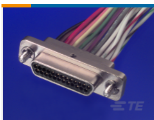
TE 产品编号 1532173-2 M83513/04-C02N, MCKS-N1-B-21S6G1-36.0