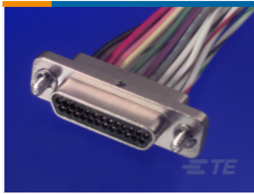
TE 产品编号 1532173-6 M83513/04-C10N, MCKS-N1-B-21S6Q1-36.0