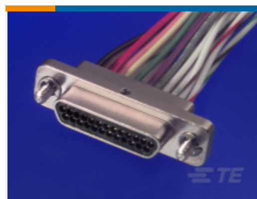
TE 产品编号 1-1532174-0 M83513/04-D14N, MCKS-N1-B-25S6G9-72.0