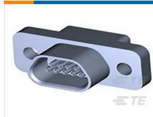
TE 产品编号 1532173-8 M83513/04-C12N, MCKS-N1-B-21S6Q9-36.0