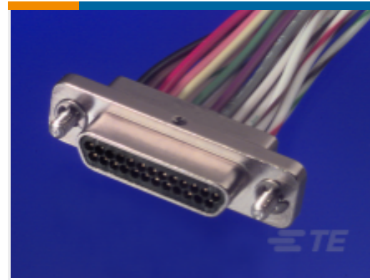
TE 产品编号 1532173-7 M83513/04-C11N, MCKS-N1-B-21S6Q9-18.0