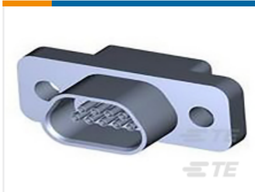
TE 产品编号 1532174-1 M83513/04-D01N, MCKS-N1-B-25S6G1-18.0