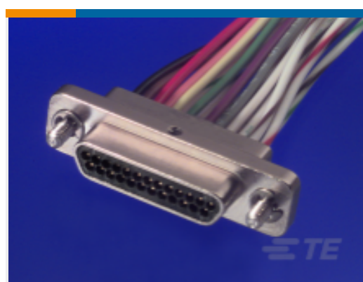
TE 产品编号 1532173-3 M83513/04-C03N, MCKS-N1-B-21S6G9-18.0