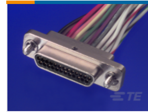
TE 产品编号 1532173-9 M83513/04-C13N, MCKS-N1-B-21S6G1-72.0