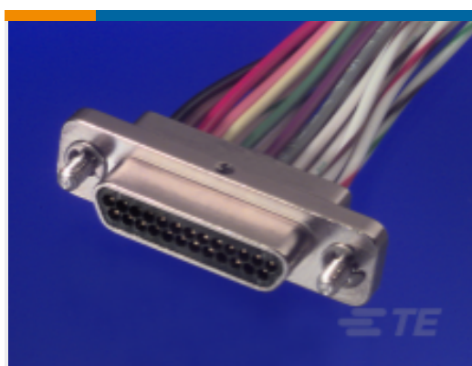
TE 产品编号 1532203-2 M83513/02-CC, MCKS-C2-B-21SS