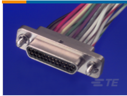
TE 产品编号 1532172-9 M83513/04-B13N, MCKS-N1-B-15S6G1-72.0