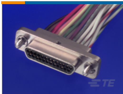
TE 产品编号 1532172-2 M83513/04-B02N, MCKS-N1-B-15S6G1-36.0