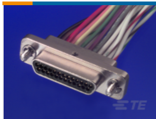
TE 产品编号 1532172-4 M83513/04-B04N, MCKS-N1-B-15S6G9-36.0