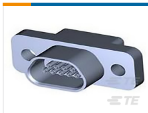
TE 产品编号 1-1532172-2 M83513/04-B16N, MCKS-N1-B-15S6Q9-72.0