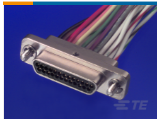
TE 产品编号 1532172-5 M83513/04-B09N, MCKS-N1-B-15S6Q1-18.0