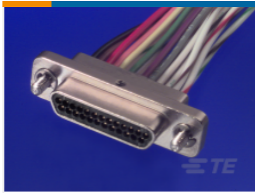
TE 产品编号 1532172-8 M83513/04-B12N, MCKS-N1-B-15S6Q9-36.0