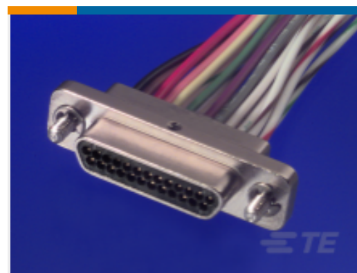
TE 产品编号 1-1532173-0 M83513/04-C14N, MCKS-N1-B-21S6G9-72.0