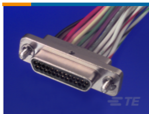
TE 产品编号 1-1532172-1 M83513/04-B15N, MCKS-N1-B-15S6Q1-72.0