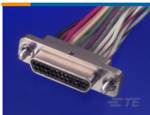
TE 产品编号 1532172-7 M83513/04-B11N, MCKS-N1-B-15S6Q9-18.0