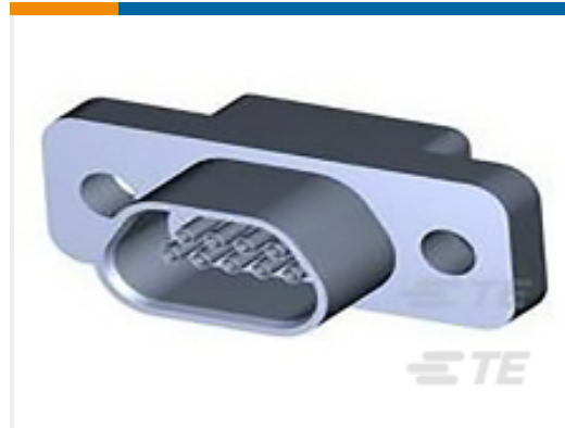
TE 产品编号 1532173-1 M83513/04-C01N, MCKS-N1-B-21S6G1-18.0