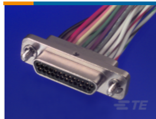
TE 产品编号 1532172-6 M83513/04-B10N, MCKS-N1-B-15S6Q1-36.0