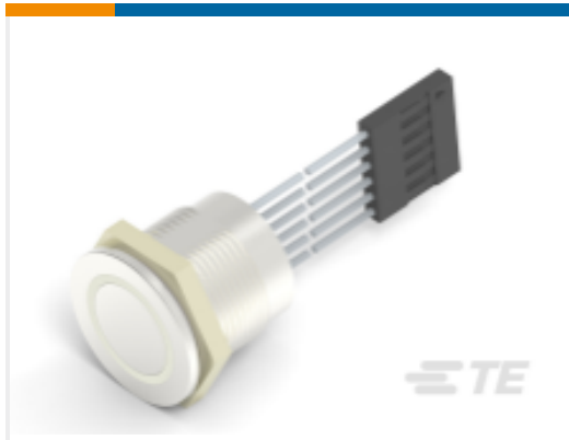
TE 产品编号2342839-3 AVP19M FLAT S04 RGB R 500MM/1X6