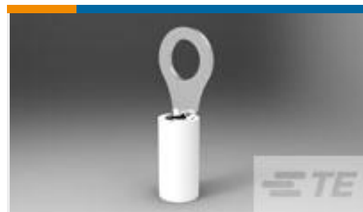
TE 产品编号50840-1 TERMINAL,PIDG PTFE R 14 10