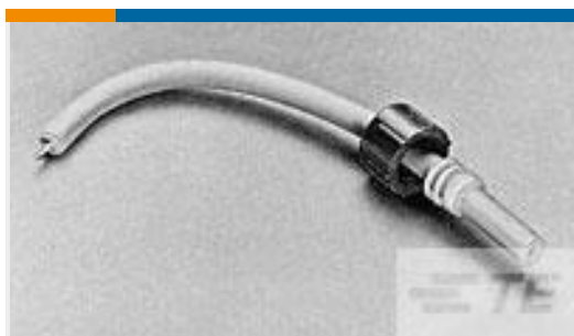
TE 产品编号3-839564-6 LEAD, SGL END ASSY, LGH