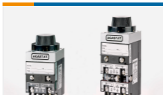
TE 产品编号7-1423157-4 7012ACH4=RLY,STD,ON,2P,120VAC,