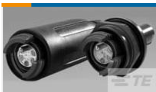
TE 产品编号 1754844-2 SHELL KIT, PRO BEAM SR SQ FL NIALBRZ