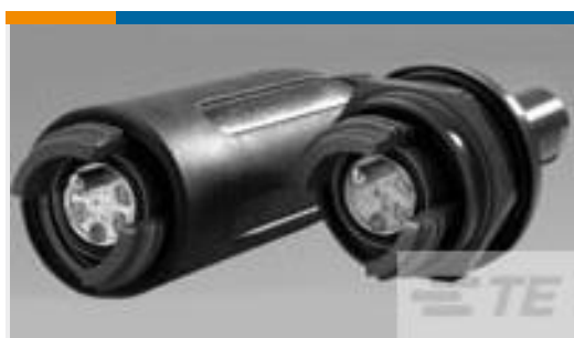
TE 产品编号 1754843-2 SHELL KIT, PRO BEAM SR D-HOLE NIALBRZ