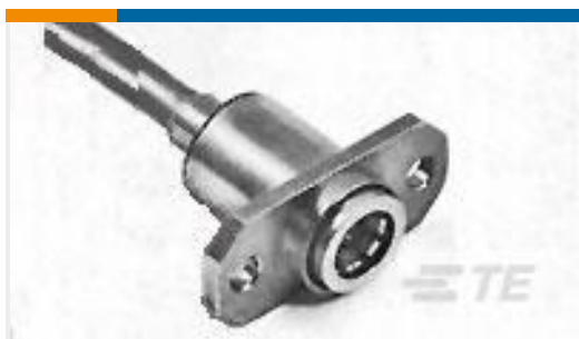
TE 产品编号1059424-1 4506 5015 02