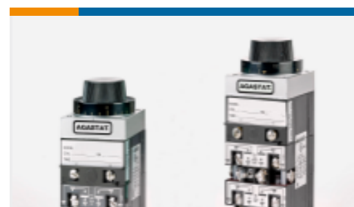
TE 产品编号7-1423157-4 7012ACH4=RLY,STD,ON,2P,120VAC,