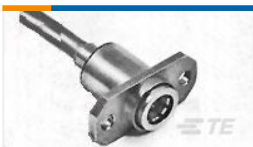
TE 产品编号1059424-1 4506 5015 02