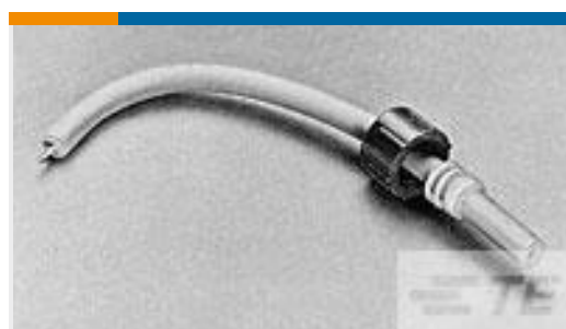
TE 产品编号3-839564-6 LEAD, SGL END ASSY, LGH