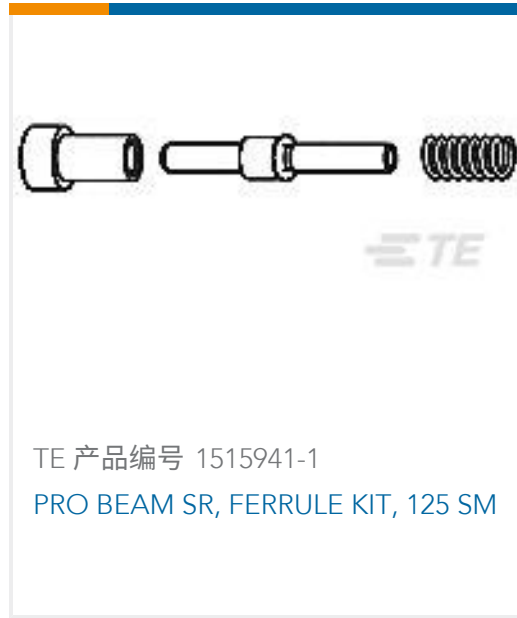
TE 产品编号 1515941-1 PRO BEAM SR, FERRULE KIT, 125 SM