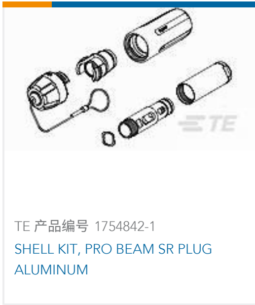
TE 产品编号 1754842-1 SHELL KIT, PRO BEAM SR PLUG ALUMINUM