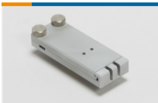
固化块、固化炉和固化套(1)