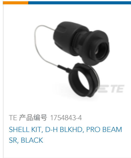
TE 产品编号 1754843-4 SHELL KIT, D-H BLKHD, PRO BEAM SR, BLACK