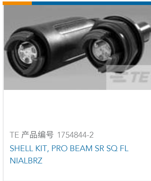
TE 产品编号 1754844-2 SHELL KIT, PRO BEAM SR SQ FL NIALBRZ