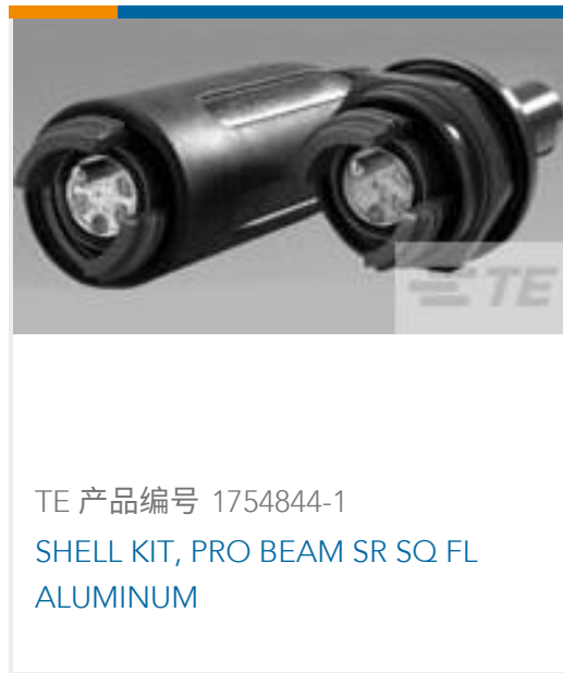
TE 产品编号 1754844-1 SHELL KIT, PRO BEAM SR SQ FL ALUMINUM