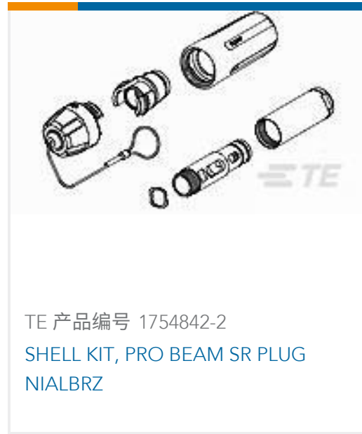
TE 产品编号 1754842-2 SHELL KIT, PRO BEAM SR PLUG NIALBRZ