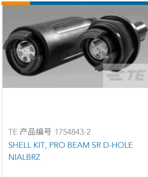
TE 产品编号 1754843-2 SHELL KIT, PRO BEAM SR D-HOLE NIALBRZ