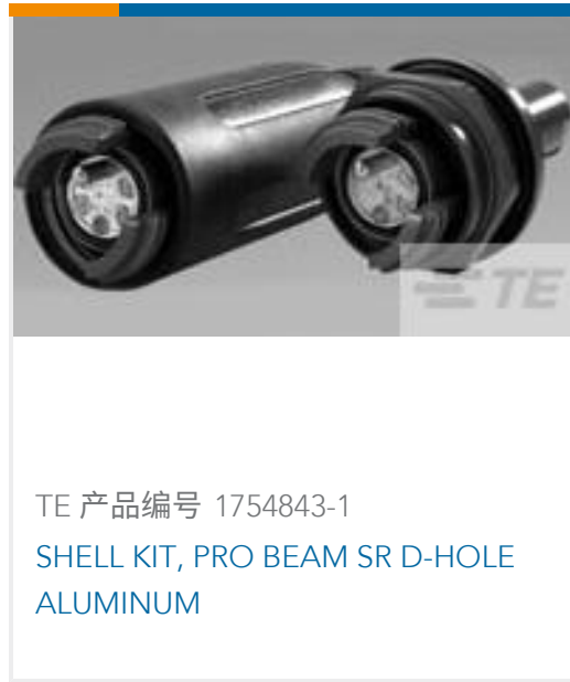
TE 产品编号 1754843-1 SHELL KIT, PRO BEAM SR D-HOLE ALUMINUM