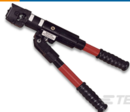
TE 产品编号 1490749-1 HYP10 8-4/0AWG MANUAL TOOL