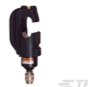
TE 产品编号 1490746-1 HYP10 LIGHT DUTY 14T HEAD