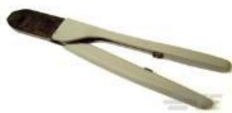
TE 产品编号 91518-1 CCII AMPMODU SHORT POINT REC 32-22 ASSY