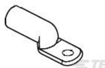
TE 产品编号 277147-3 TERMINAL, COPALUM R 8 1/4