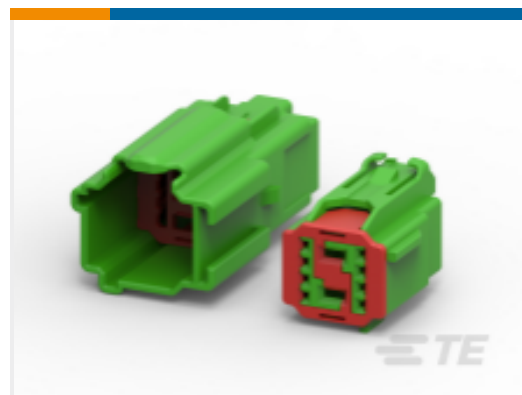
TE 产品编号1438136-1 GET .64 连接器系统，连接器壳体