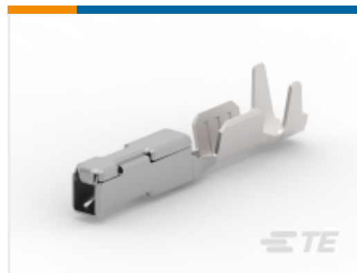
TE 产品编号1456968-2 CONTACT, FEMALE, 0.64, 18 AWG, AG