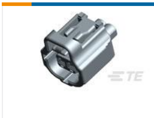
TE 产品编号184004-1 2 POS. PLUG ASSY, KEY C, BLACK