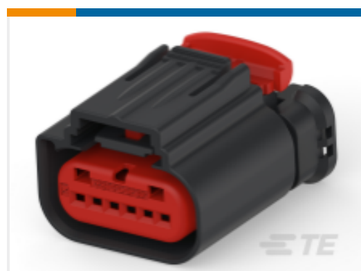
TE 产品编号1326942-3 1 X 6 SEALED MAF CONN ASSY 1&6 blocked