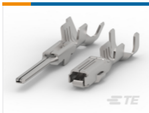
TE 产品编号1326032-6 1.5/2.8 连接器系统，母端和公端