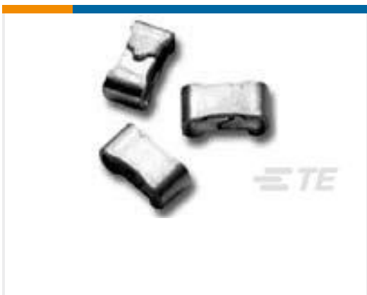
TE 产品编号1625854-3 0603 PROBE PAD