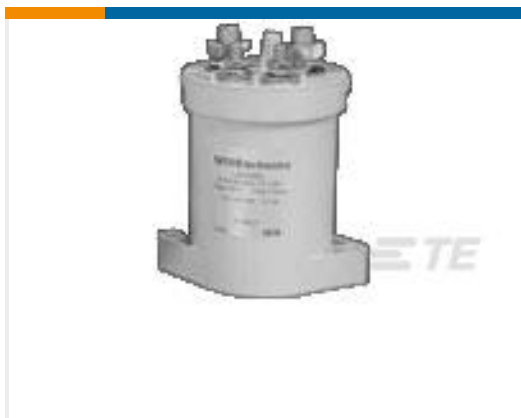
TE 产品编号4-1618388-6 LEV200A5NAA=RELAY, SPST-NO