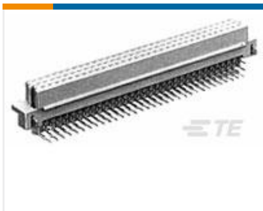
TE 产品编号5650868-5 ASSY,RECEPTACLE,EUROCARD,TYPE R/2,LEAD-F