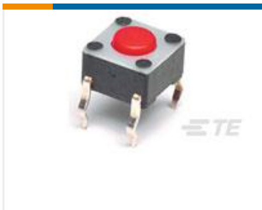
TE 产品编号1-1825910-0 FSM6JH=6MM TACT SWITCH, HIGH TEMP