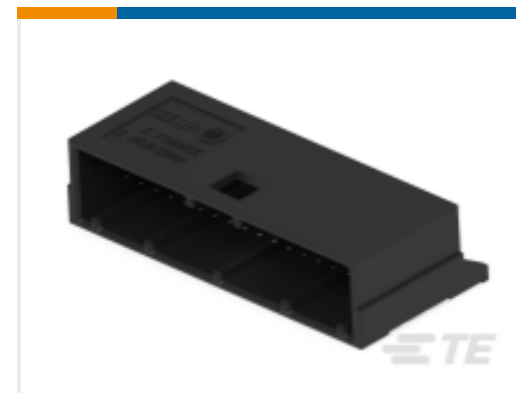
TE 产品编号2386141-1 32POS,TAB0.5X0.4,HDR ASSY,90DEG, SMD