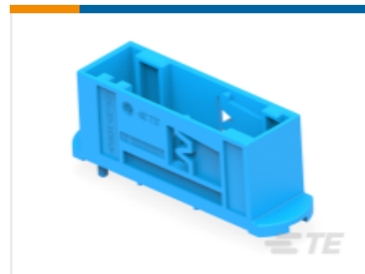
TE 产品编号2306247-2 32POS,TAB0.63X0.63,HDR ASSY, 180DEG,SLDR