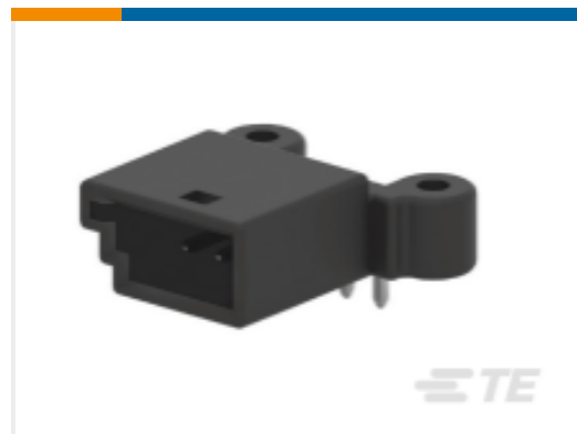
TE 产品编号1318382-8 Signal Header