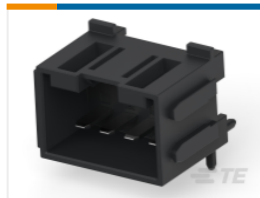
TE 产品编号2321709-1 4POS,TAB2.8X0.8,HDR ASSY,180DEG, SLDR