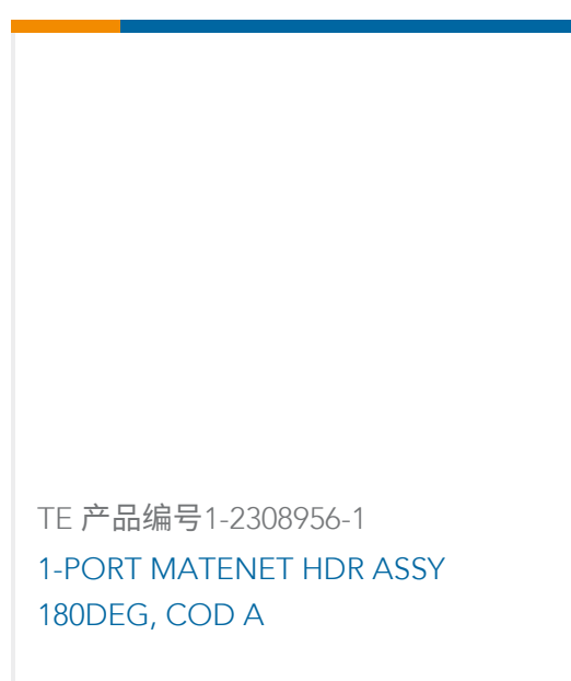
TE 产品编号1-2308956-1 1-PORT MATENET HDR ASSY 180DEG, COD A