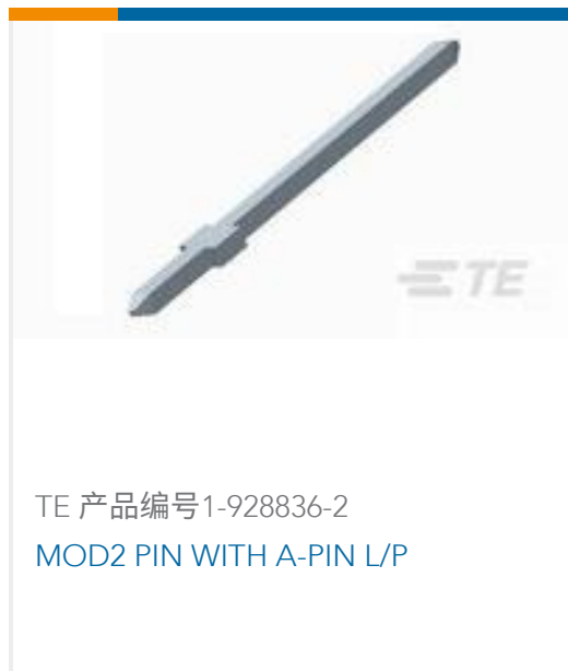
TE 产品编号1-928836-2 MOD2 PIN WITH A-PIN L/P