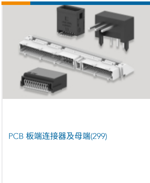
PCB 板端连接器及母端(299)