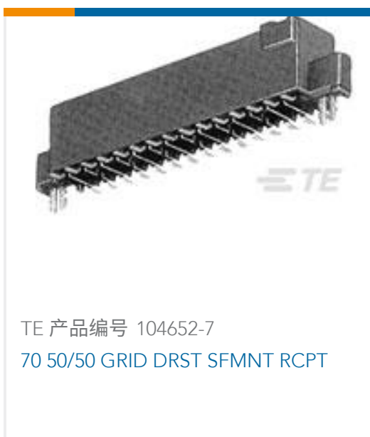
TE 产品编号 104652-7 70 50/50 GRID DRST SFMNT RCPT