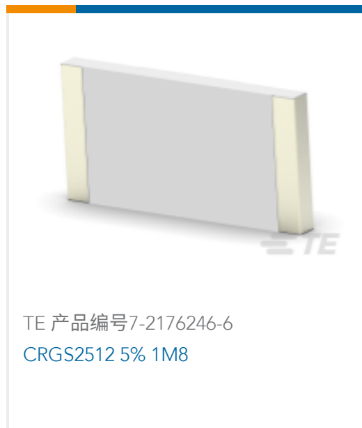
TE 产品编号7-2176246-6 CRGS2512 5% 1M8