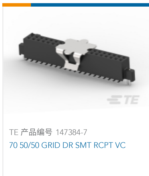
TE 产品编号 147384-7 70 50/50 GRID DR SMT RCPT VC