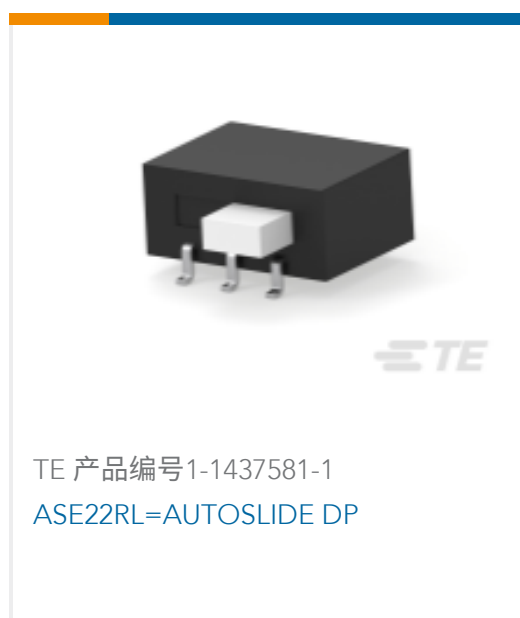
TE 产品编号1-1437581-1 ASE22RL=AUTOSLIDE DP 0.3W