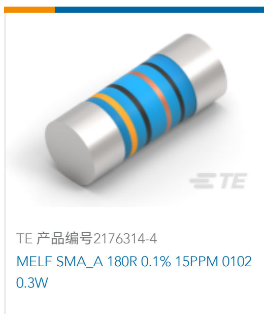
TE 产品编号2176314-4 MELF SMA_A 180R 0.1% 15PPM 0102 0.3W