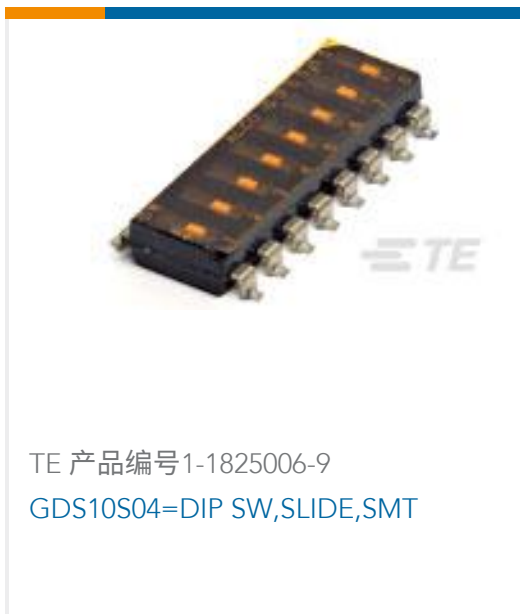
TE 产品编号1-1825006-9 GDS10S04=DIP SW,SLIDE,SMT