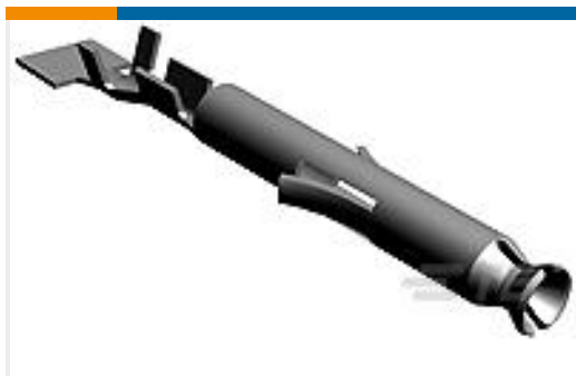
TE 产品编号1-770834-0 MINI UMNL SOK AU LF