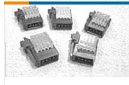
TE 产品编号1473562-3 RITS CONN. PLUG ASSY 3P YELLOW