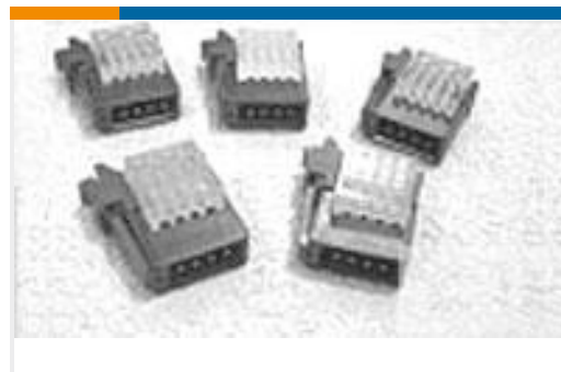
TE 产品编号2-1473562-3 RITS CONN. PLUG ASSY 3P BLUE