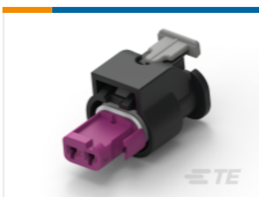
TE 产品编号4-2355506-1 2POS, MCON 1.2, REC HSG ASSY, SLD, COD A