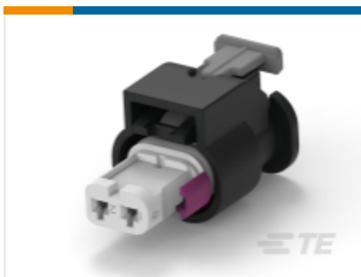
TE 产品编号2-2355506-5 2POS, MCON 1.2, REC HSG ASSY, SLD, COD B