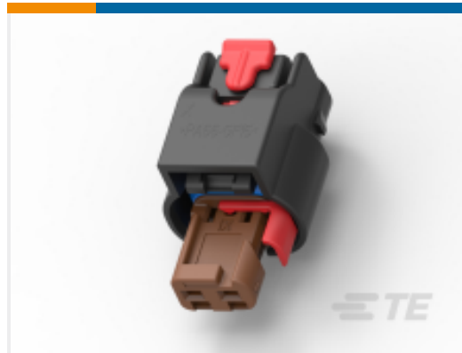
TE 产品编号2098557-4 2POS, MCON 1.2 CB REC 2p TL SEALED