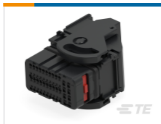
TE 产品编号2352245-1 48POS, MQS, REC HSG ASSY, SLD, COD 1