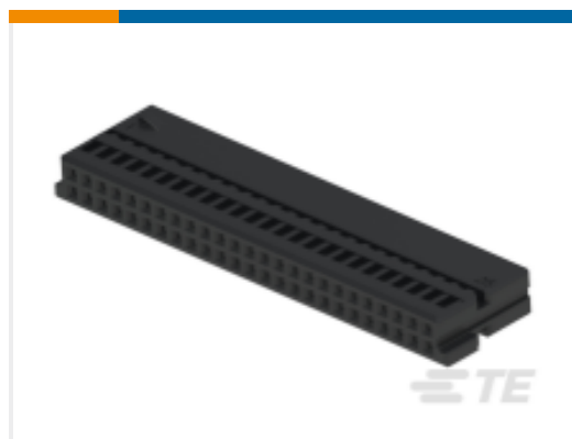
TE 产品编号2324105-2 50POS, MQS, SOCK HSG