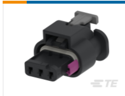
TE 产品编号1-2355507-5 3POS, MCON 1.2, REC HSG ASSY, SLD, COD A