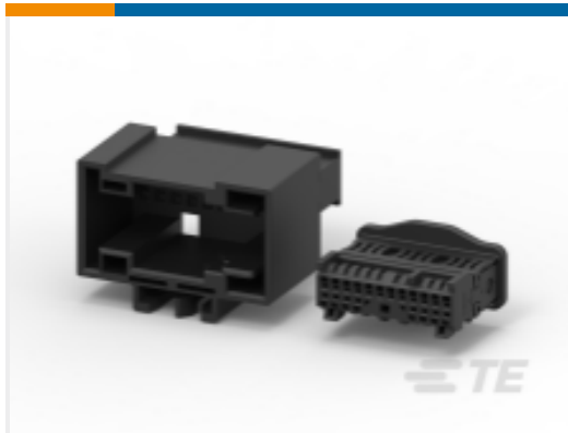
TE 产品编号1534125-1 MQS 连接器外壳