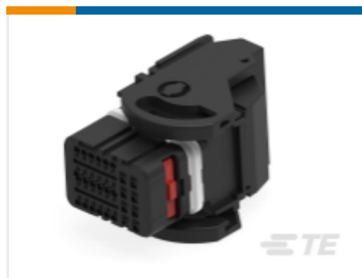
TE 产品编号2352158-8 32POS, MQS, REC HSG ASSY, SLD, COD 1