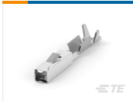
TE 产品编号1411576-1 ELO 0.63, CONTACT