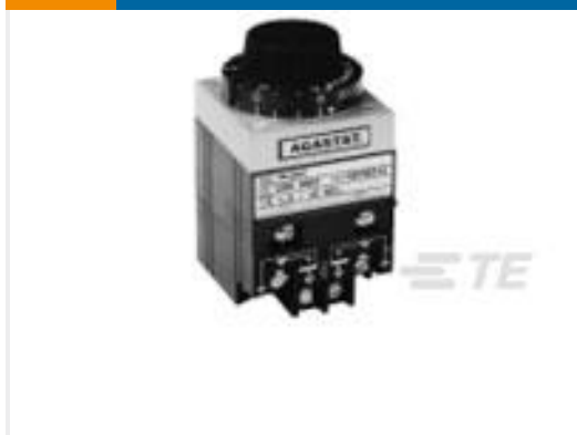
TE 产品编号 6-1755142-4 7022WDIM=RLY,STD,OFF,2P,96V,50S,I, M