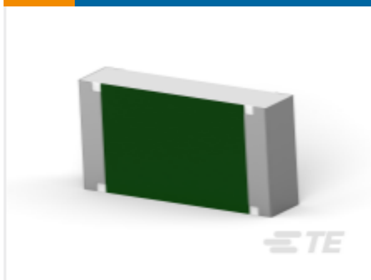
TE 产品编号 2176398-2 3502 15K 1%