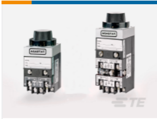
TE 产品编号 1755170-1 7022OCIM=RLY,STD,OFF,2P,24V,15S,I, M