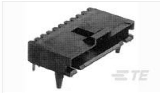
TE 产品编号5-104361-4 05 MTE HDR SRRA LATCH W/HLDWN