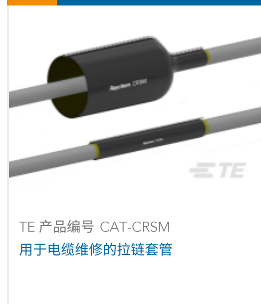
TE 产品编号 CAT-CRSM 用于电缆维修的拉链套管