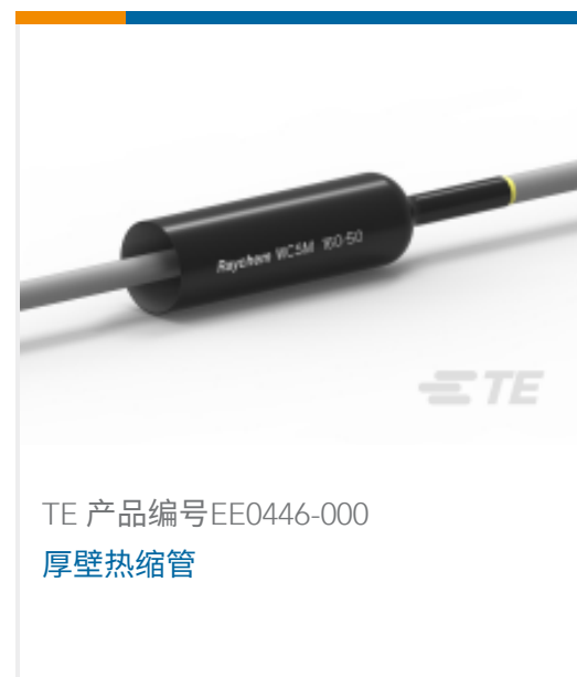
TE 产品编号EE0446-000 厚壁热缩管