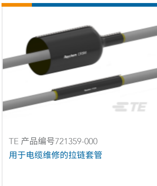
TE 产品编号721359-000 用于电缆维修的拉链套管