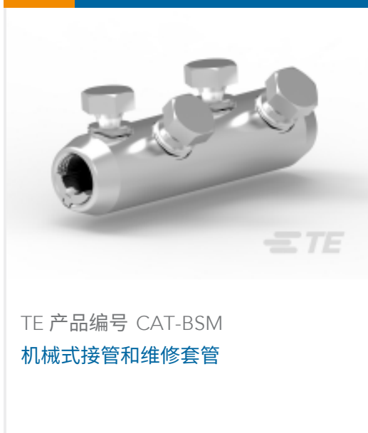
TE 产品编号 CAT-BSM 机械式接管和维修套管