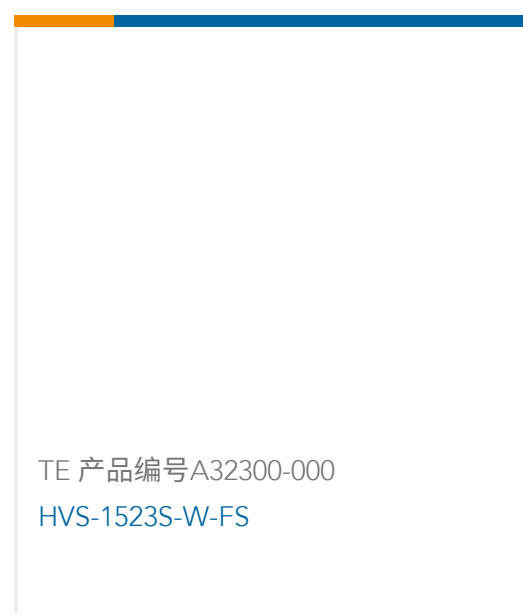
TE 产品编号A32300-000 HVS-1523S-W-FS