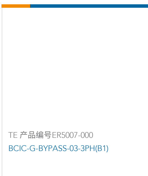
TE 产品编号ER5007-000 BCIC-G-BYPASS-03-3PH(B1)