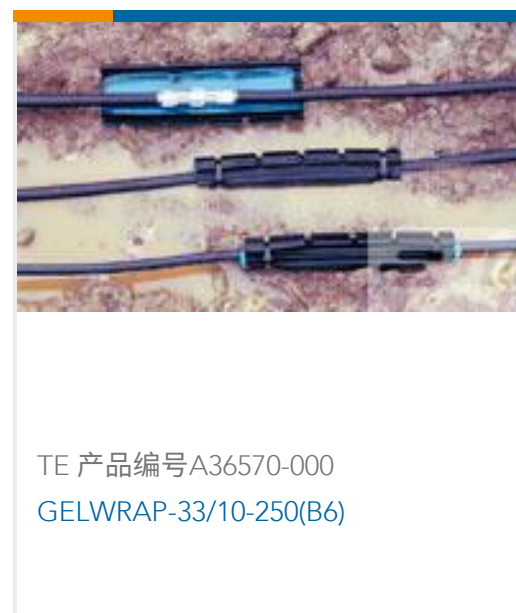
TE 产品编号A36570-000 GELWRAP-33/10-250(B6)