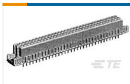
TE 产品编号650405-5 150 EURO TYPE C RECEPT ST ASSY