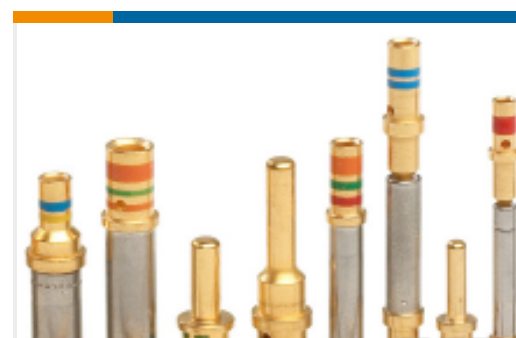
TE 产品编号100503L CONT SOC ASSY