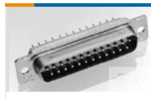
TE 产品编号1757826-6 AMPLIMITE,ASY,RCPT,FB,90,ZN,6