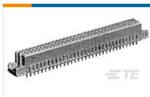
TE 产品编号535071-4 048 EURO TYPE C RECEPT ST ASSY