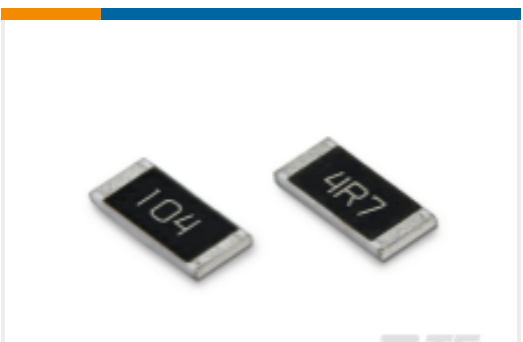
TE 产品编号1-2176455-1 CPF 0402 5R36 0.1% 25ppm 1K RL