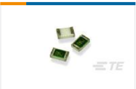
TE 产品编号6-1879061-2 CPF 0402 3K3 0.1% 25PPM 5K RL