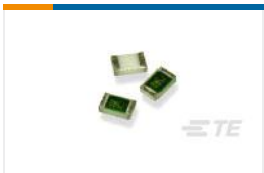
TE 产品编号5-1879214-2 CPF 0402 1K18 0.1% 25PPM 1K RL