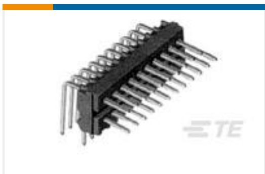
TE 产品编号5-104746-2 22 SYS 50 HDR DRRA UNSHRD SN