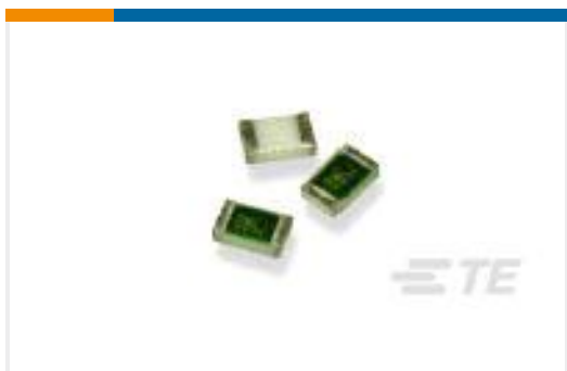
TE 产品编号1-1879214-5 CPF 0402 453R 0.1% 25PPM 1K RL