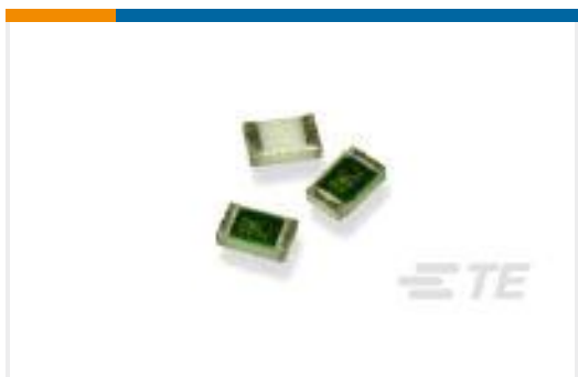
TE 产品编号2-1879215-2 CPF 0402 6K65 0.1% 25PPM 1K RL