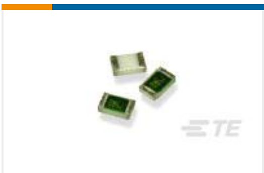
TE 产品编号1879214-5 CPF 0402 357R 0.1% 25PPM 1K RL