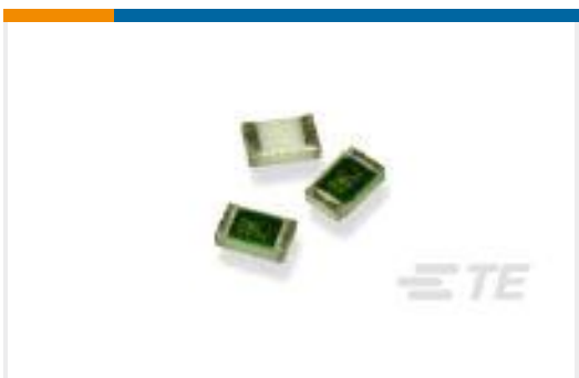
TE 产品编号4-1879213-9 CPF 0402 84R5 0.1% 25PPM 1K RL