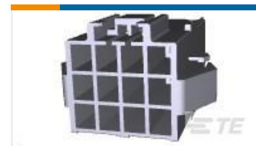
TE 产品编号176299-1 UNVI POWER CAP HSG 12P PNL MTG