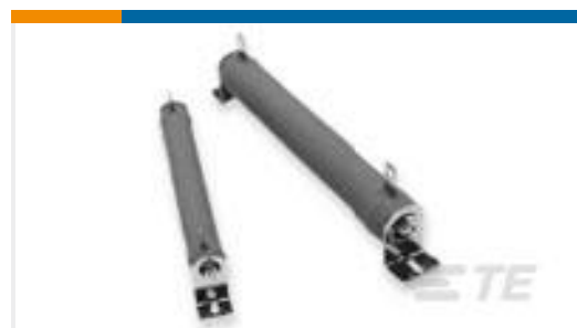
TE 产品编号1879457-7 TE 2500W 3R3 5% Bracket