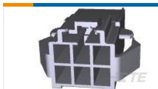
TE 产品编号176295-1 UNIV POWER CAP HSG 6P P/MOUNT