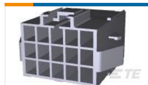
TE 产品编号176300-1 UNVI POWER CAP HSG 15P PNL MTG