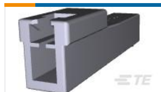
TE 产品编号176281-1 UNIV POWER CAP HSG 1P F/H