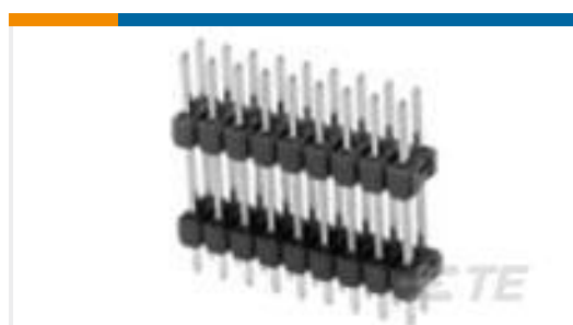
TE 产品编号 146489-4 08 MODII HDR DRST UNSHRD STKG