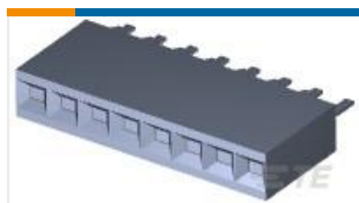
TE 产品编号 5-146763-2 08 MODII RCPT VERT SR