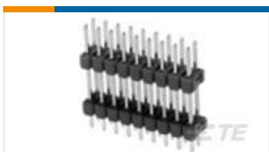
TE 产品编号 5-146489-4 08 MODII HDR DRST UNSHRD STKG