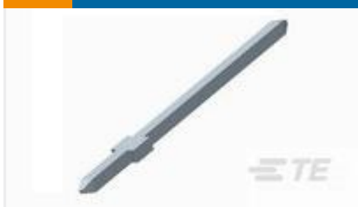
TE 产品编号1-928836-2 MOD2 PIN WITH A-PIN L/P