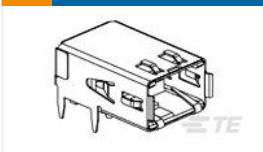
TE 产品编号1761072-3 RECPT,HSSDC2,FIBRE,TRAY PKG