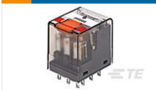
TE 产品编号3-1415020-1 PT570N20