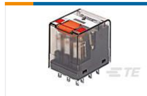
TE 产品编号3-1415020-1 PT570N20