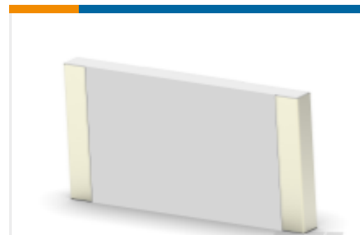
TE 产品编号7-2176246-6 CRGS2512 5% 1M8