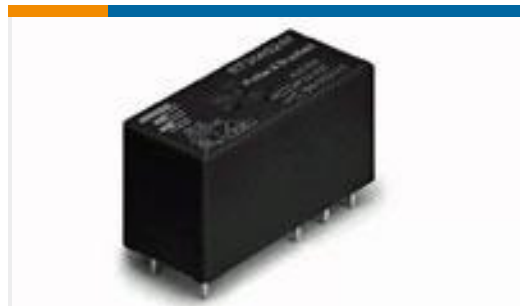
TE 产品编号3-1393237-3 RTE24024F