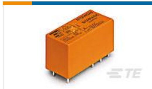
TE 产品编号1649329-4 RTE24012