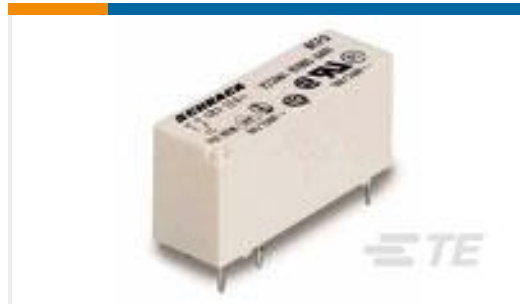
TE 产品编号9-1393222-7 V23061B1005A501=MINISTARKSTROM