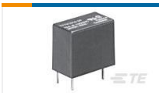
TE 产品编号2-1393194-7 T77V1D3-24