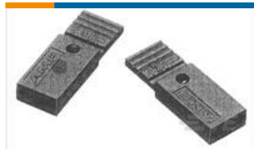
TE 产品编号880584-1 SHUNT CONNECTOR