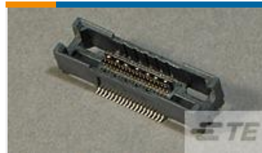
TE 产品编号2-5767004-2 MICTOR RECEPT ASSY, 38 POS.