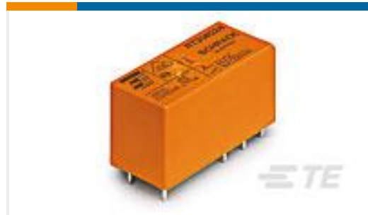
TE 产品编号1393239-8 RT114006