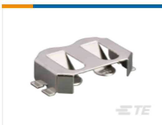
TE 产品编号BAT-HLD-012-SMT Battery Holder 1216 1225 SMT Bulk Pack