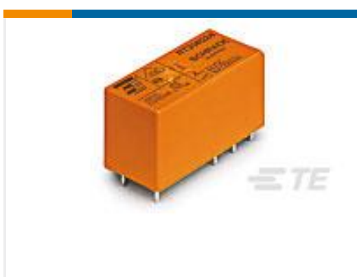
TE 产品编号1649328-4 RTD14012