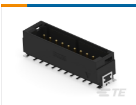
TE 产品编号464686-E DRCQ 2,54 20 M * SMD * 137 E012 094 GU-H