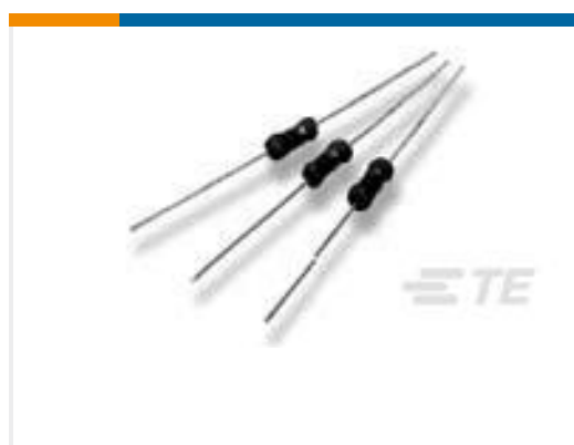
TE 产品编号3-1625886-6 1W SM M/OX 5% 68R