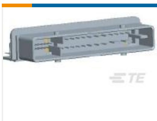
TE 产品编号1534531-2 TAB HEADER ASSY 38P