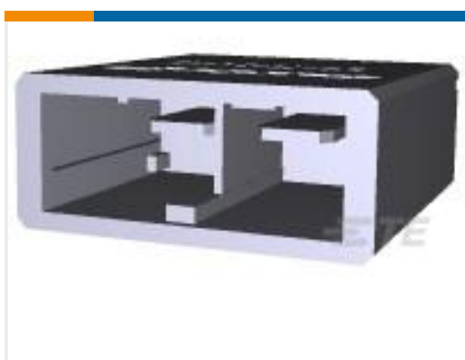
TE 产品编号2-353080-2 DYNAMIC D-5200 HDR V ASSY 2P