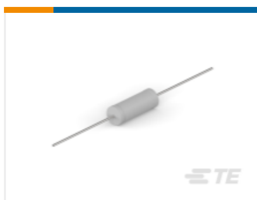
TE 产品编号2176412-8 5W XSM M/OX 5% 10R